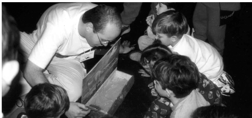
Figura 2: Utilização da caixa de fossilização para demonstração do processo de formação de um fóssil. Atividade realizada durante as “Férias na Escola”.

confeção de réplicas de fósseis e do sucata-sauro (dinossauro com corpo em espuma e ornamentado com sucata), além de caça ao fóssil.