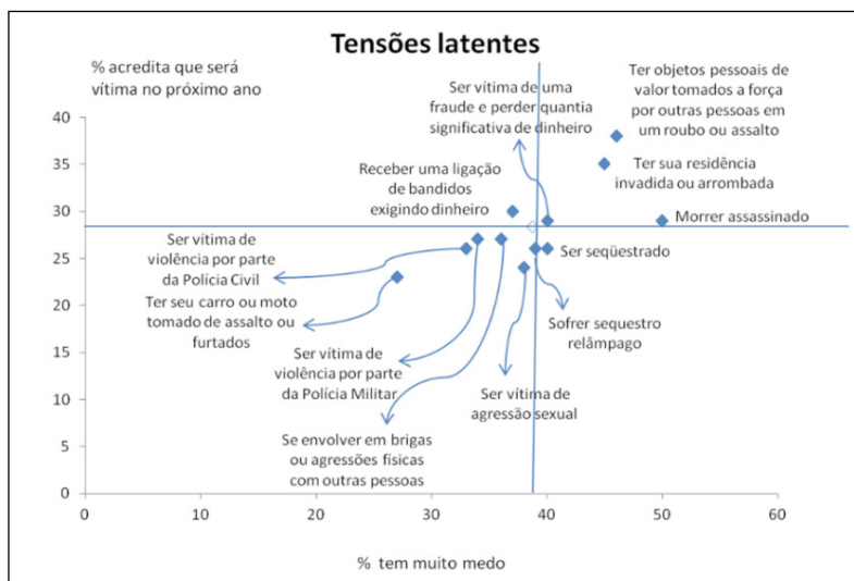
Gráfico 3. Cruzamento entre as distribuições percentuais de medo de eventos criminosos e certeza de que esses eventos irão acontecer no próximo ano – Brasil (2012)