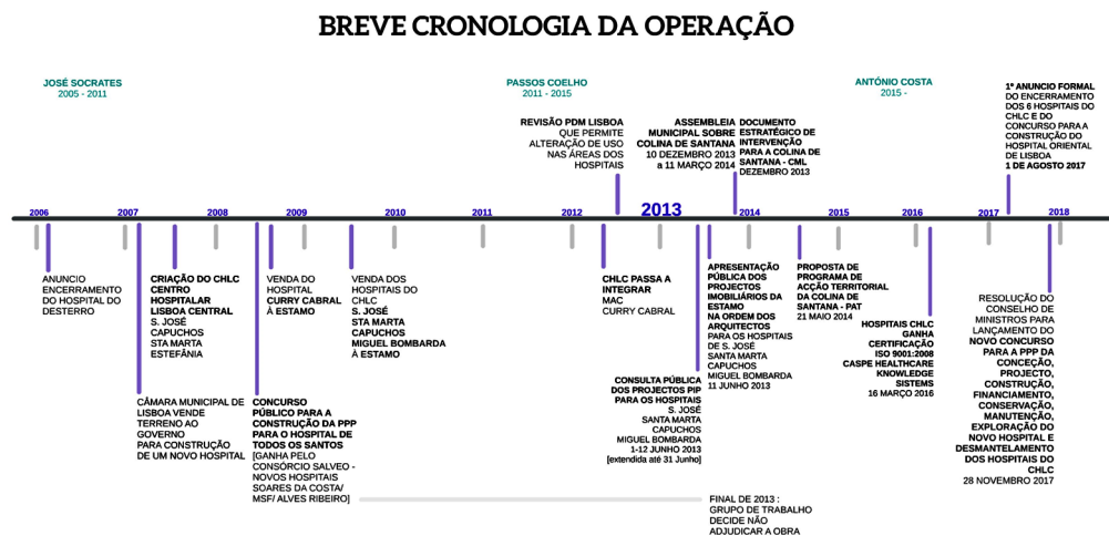
Figura 2 – Cronologia da operação de revalorização da Colina de Santana