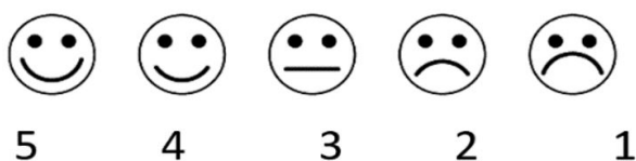
Figura 1. Escala Visual das Faces

3 para “audição mais ou menos”, 4 “audição boa” e 5 “audição muito boa”.