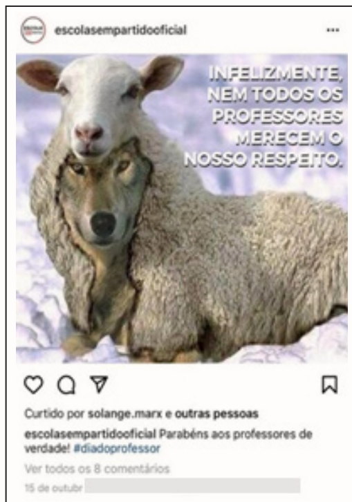
Figura 5 Professor “lobo”