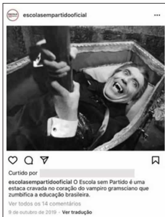
Figura 7 “Vampiro com estaca”