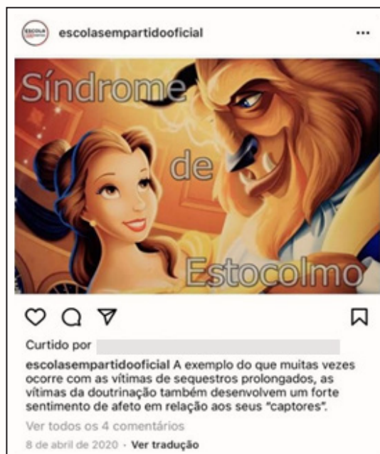
Figura 3 Síndrome de Estocolmo