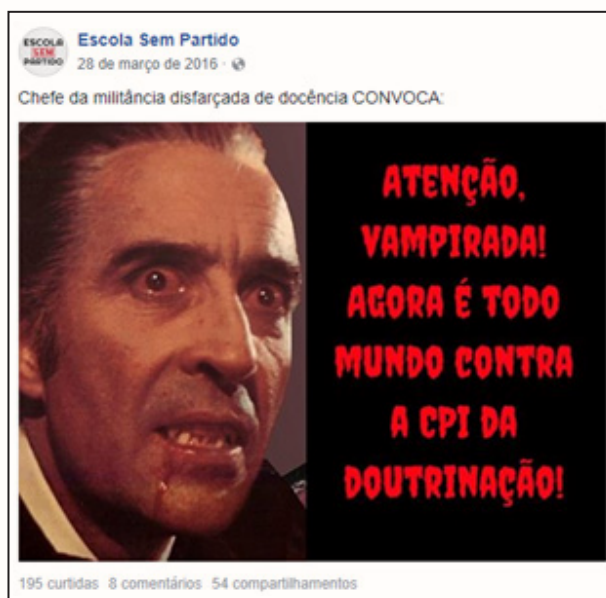
Figura 6 "Professor vampiro"