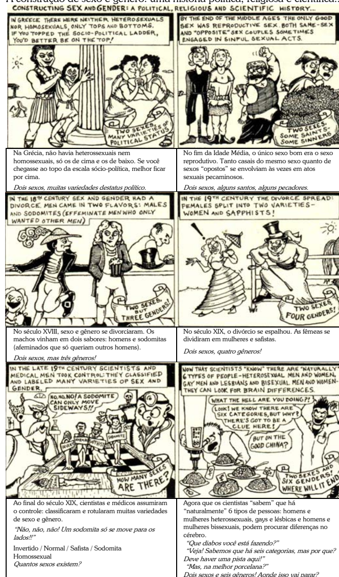
Figura 1 - Uma história do sexo e do gênero em quadrinhos.