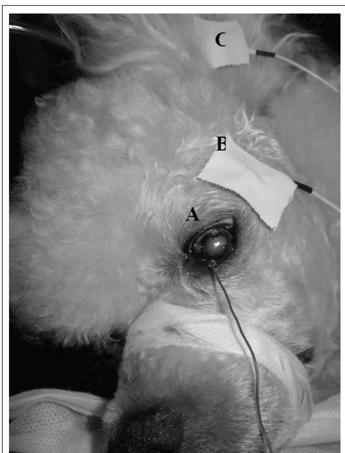
Figura 1 - Câo da raça Poodle macho, com os eletrodos devidamente posicionados. 1A- eletrodo monopolar de lente de contato ERG-jet posicionado sobre a córnea; 1B- eletrodo de referência de cúpula de ouro (Grass) posicionado no canto lateral do olho testado e recoberto por esparadrapo; 1C- eletrodo-terra de cúpula de ouro (Grass) posicionado na face interna do pavilhão auricular e recoberto por esparadrapo.

Para as três respostas, foram utilizados, em média, 16 estímulos, e a duração dos exames foi de aproximadamente 50 minutos, e 30 corresponderam ao tempo de adaptação ao escuro. Ao término do exame, mensurou-se a amplitude pico a pico (pico da onda-a até o pico da onda-b) em microvolts ( \mu V ), e o tempo de culminação da onda-b (início do estímulo até o pico da onda-b) em milissegundos (ms), nas três respostas de cada paciente. Respostas atenuadas ou extintas foram excluídas da análise estatística. Caso o animal apresentasse resultado sugestivo de degeneração retiniana unilateral, manteve-se a resposta do melhor olho.