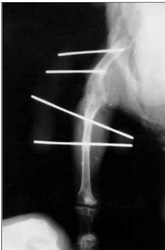
Figura 3 - Artrodese de joelho em papagaio ( Amazona aestiva ). Aspecto radiográfico após 60 dias do procedimento cirúrgico, observar (seta) a união (artrodese) entre o fêmur e o tibiotarso.