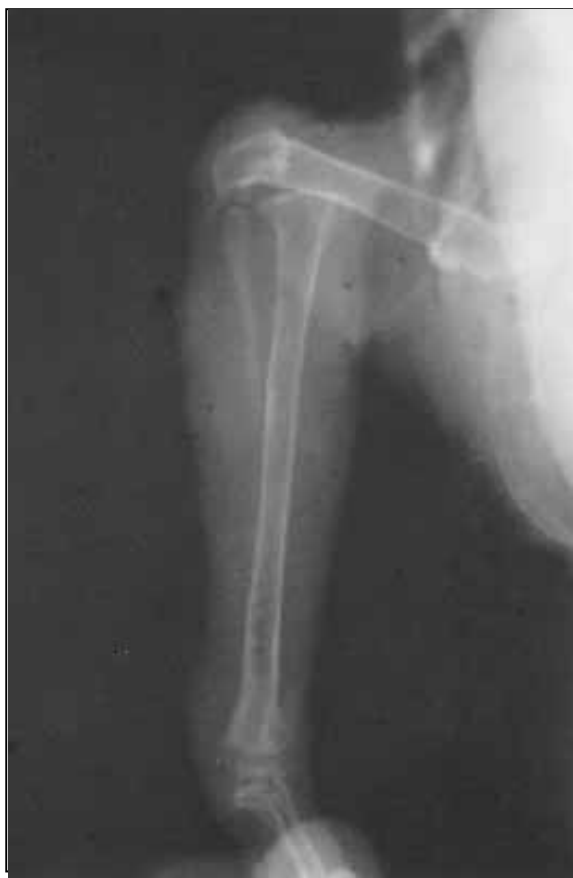
Figura 1 - Artrodese de joelho em papagaio ( Amazona aestiva ). Aspecto radiográfico da luxação do joelho.

para obtenção da artrodese do joelho, permitindo o uso precoce do membro e assim evitando a atrofia muscular.