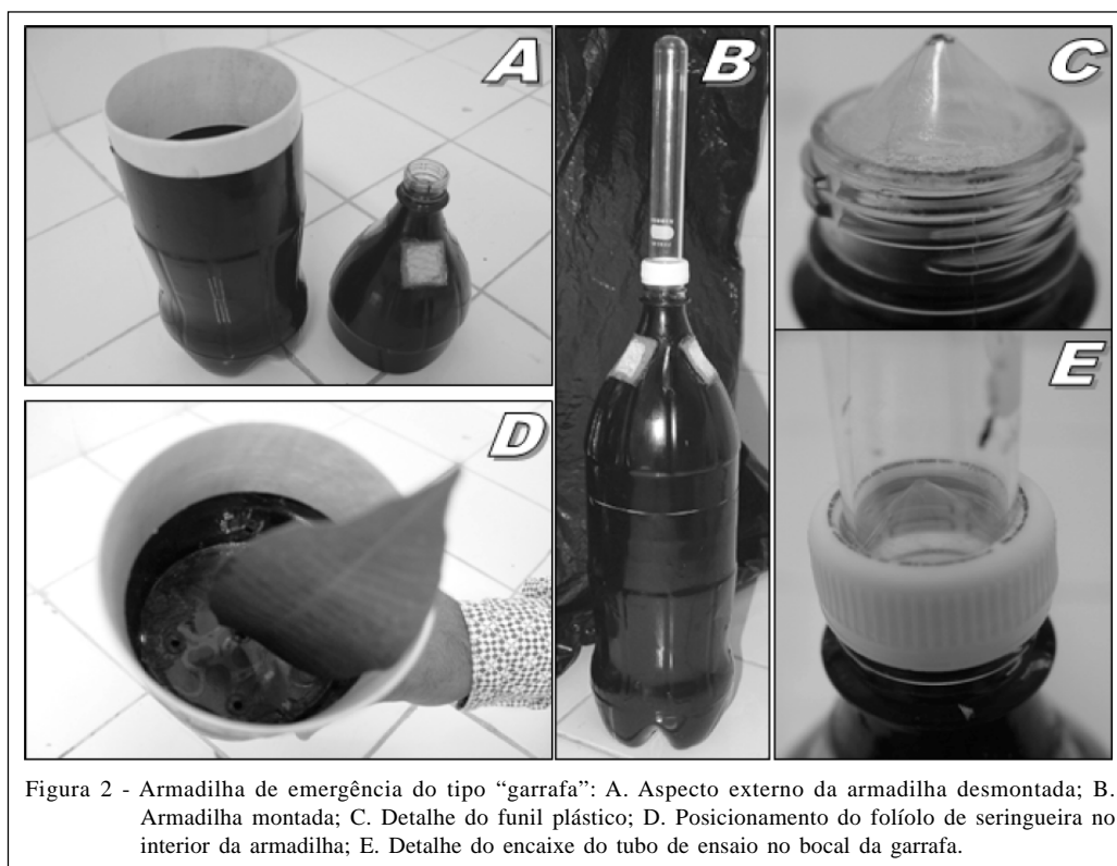
Figura 2 - Armadilha de emergência do tipo “garrafa”: A. Aspecto externo da armadilha desmontada; B. Armadilha montada; C. Detalhe do funil plástico; D. Posicionamento do folíolo de seringueira no interior da armadilha; E. Detalhe do encaixe do tubo de ensaio no bocal da garrafa.

dobradiças, tipo baú e quatro pernas de madeira de 50cm (Figura 1A). Internamente a armadilha foi pintada com tinta esmalte preta (Figura 1C) e externamente com tinta látex branca (Figura 1A). No seu interior havia um fundo falso perfurado, onde foram inseridos os pecíolos de cada folíolo (Figura 1C). A armadilha foi cortada em um dos seus lados, sendo encaixada logo abaixo do fundo falso uma bandeja de ferro (10cm de altura x 39,5cm de largura x 60cm de comprimento), contendo água, onde os pecíolos ficavam imersos (Figura 1B e 1C). Tubos de ensaio, com tampas de rosca perfuradas, foram dispostos externamente à armadilha, totalizando 18 tubos no total. As tampas de rosca foram coladas na madeira, permanecendo fixas. Na parte externa e frontal da armadilha, foram instaladas duas ventoinhas e quatro lâmpadas fluorescentes de 25W (uma em cada lado) (Figura 1A) e dois interruptores (um para as lâmpadas e outro para as ventoinhas) na lateral da armadilha (Figuras 1A e 1B).