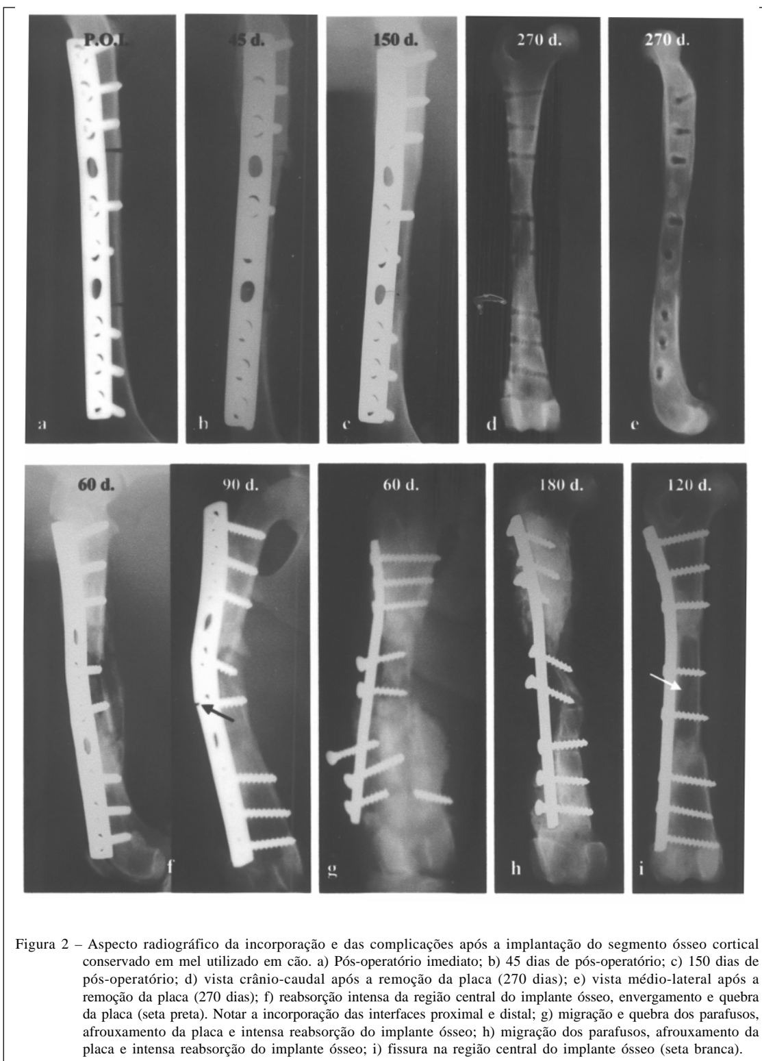
Figura 2 – Aspecto radiográfico da incorporação e das complicações após a implantação do segmento ósseo cortical conservado em mel utilizado em cão. a) Pós-operatório imediato; b) 45 dias de pós-operatório; c) 150 dias de pós-operatório; d) vista crânio-caudal após a remoção da placa (270 dias); e) vista médio-lateral após a remoção da placa (270 dias); f) reabsorção intensa da região central do implante ósseo, envergamento e quebra da placa (seta preta). Notar a incorporação das interfaces proximal e distal; g) migração e quebra dos parafusos, afrouxamento da placa e intensa reabsorção do implante ósseo; h) migração dos parafusos, afrouxamento da placa e intensa reabsorção do implante ósseo; i) fissura na região central do implante ósseo (seta branca).

(GREENWOOD, 1993), e ter como principal indicação medicinal o tratamento de feridas (POSTMES et al., 1993), a sua escolha como meio para a preservação de implantes ósseos foi baseada principalmente nos