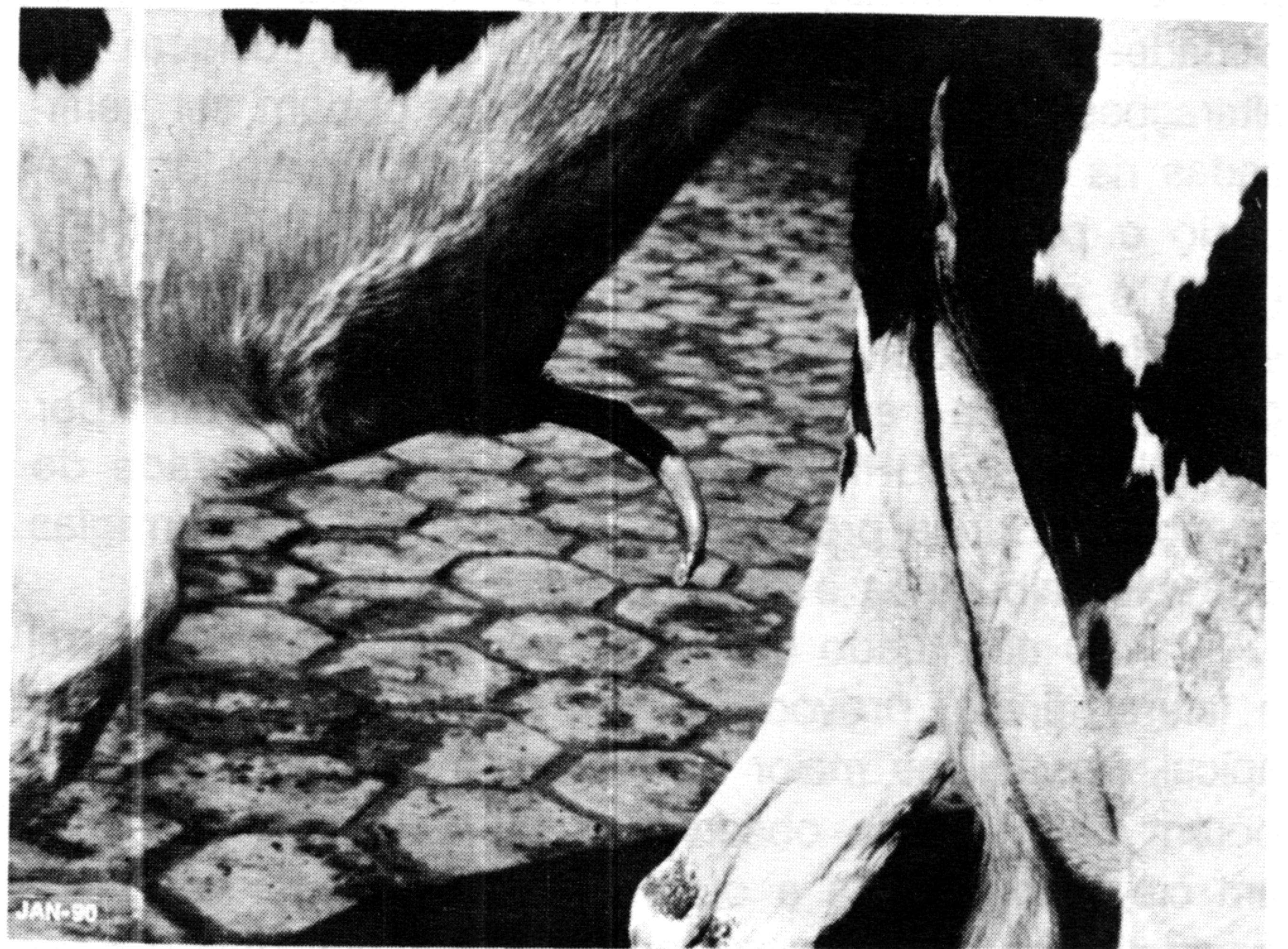
FIGURA 2 - Aspectos do desvio do pênis do rufião no sentido ventral e lateral direita, quando da detecção de vacas em cio.

Decorridos 20 dias da intervenção cirúrgica, os animais foram novamente colocados em presença de fêmeas em cio, sendo notado acentuado desvio de pênis no sentido ventral e lateral direito, com total incapacidade de realização da cópula (Fig. 2).