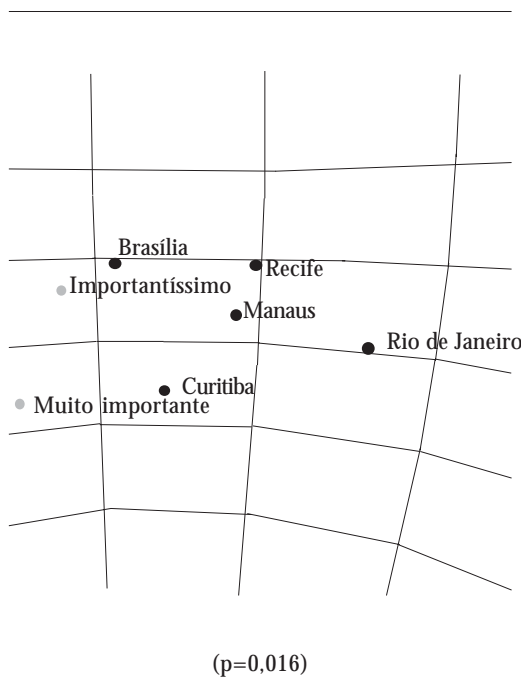
Gráfico 2. Análise das respostas dos especialistas sobre a importância do indicador “Proporção de unidades que realizam atividades de identificação e reconhecimento da rede de suporte social para a pessoa idosa” para o atendimento dos CAPS, segundo o município.