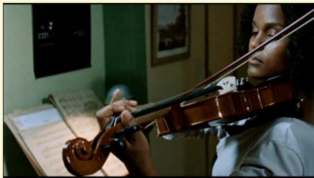
Figura 13: “uma moça negra” [42min30s]

Outro fato que chamou a atenção na AD do filme e que não poderia deixar de ser comentado diz respeito ao terceiro curta-metragem, Concerto para violino , considerado o mais estereotipado dos cinco por retratar tráfico de drogas e violência. Diferentemente dos outros curtas, em que a descrição prioriza ações, nesse episódio, o audiodescritor apresenta Jota como “rapaz branco e loiro” e Marcinha e sua família como “uma moça negra” e “uma senhora e uma garotinha negras”, contrariando a recomendação do Guia (já que não é relevante para a trama e reforça estereótipos).