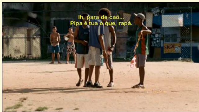
Figura 11 (1h09min19s)