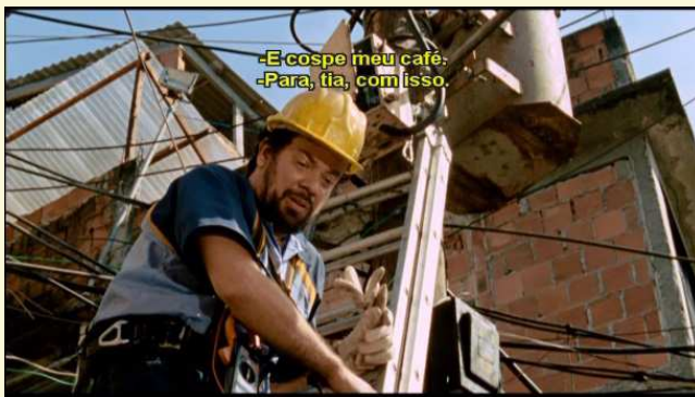
Figura 10 (1h24min52s)

Segundo o Guia , “há marcas muito fortes de regiões, culturas, idades etc. que fazem parte da caracterização” (2016, p. 66) e não devem ser suprimidas. Por outro lado, as hesitações, a fala “telegráfica” e a segmentação podem ser apagadas ou agrupadas em grupos maiores. Por fim, algo que se repete e que pode causar problema na interpretação é a falta de acentuação, como no caso de é por e.