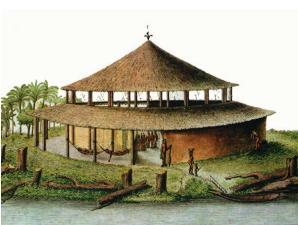
Povos indígenas (à esq.) e malocas em desenhos do brasileiro Alexandre Rodrigues Ferreira.

Para Samuel Fritz, o que diferencia fundamentalmente os portugueses dos espanhóis é que os primeiros são predadores dos povos indígenas por meio de guerras e escravização, enquanto os espanhóis, mesmo tendo usado métodos igualmente violentos em seus contatos com os povos indígenas, têm modificado o conteúdo dessas relações em direção a uma conduta de convivência marcada pela tolerância e pela cooperação mútua.