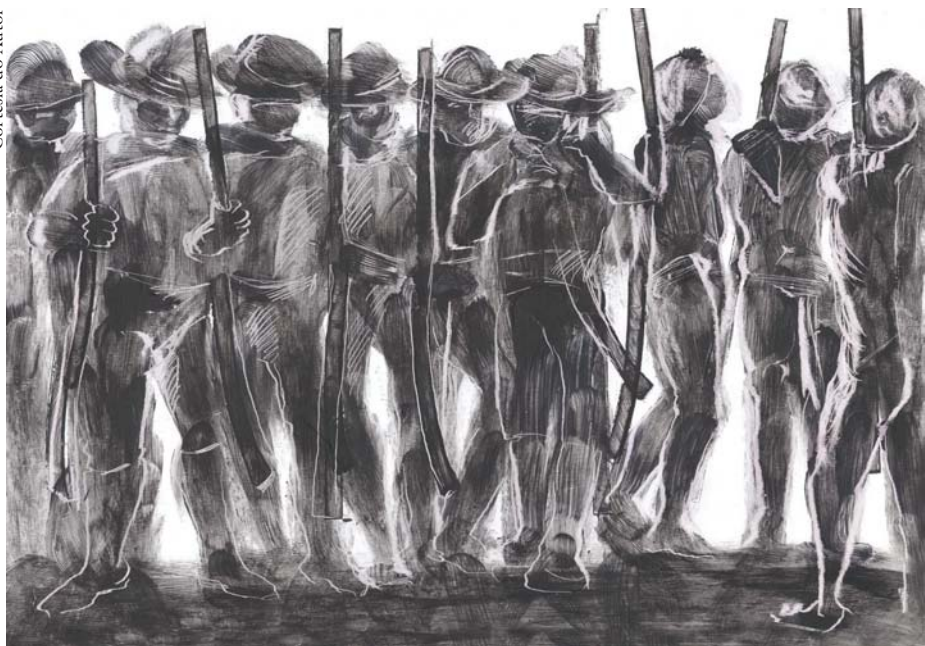
Desenhos de Carlos Rojas.