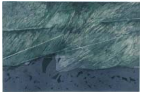
S/título (metal), 57 x 76 cm