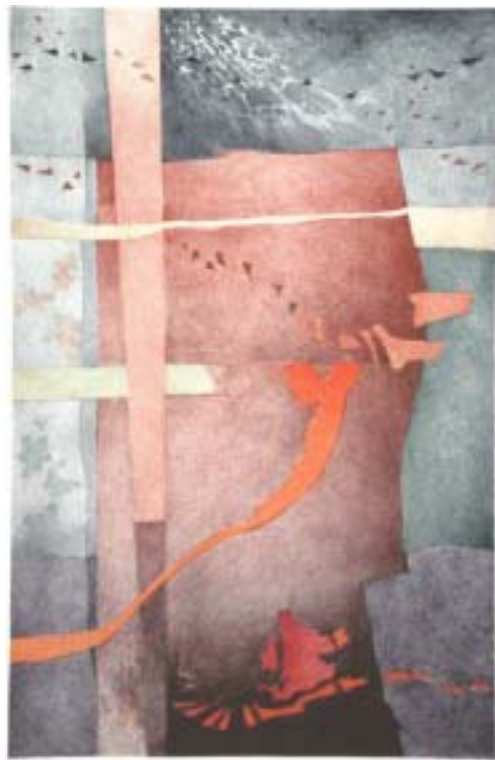
Arroio (litografia), 40 x 60 cm