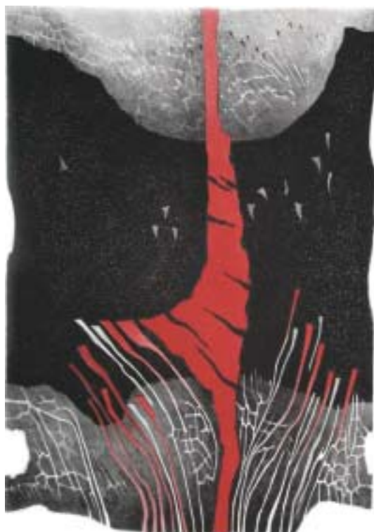
O vermelho e o negro 2 (litografia), 56 x 76 cm