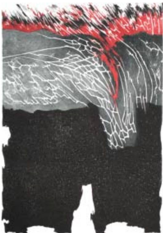
O vermelho e o negro (litografia), 56 x 76 cm