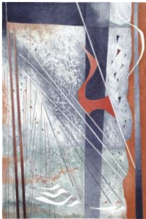
Icaro (litografia), 56 x 76 cm