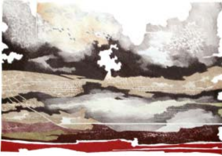
Memória (litografia), 53 x 73 cm