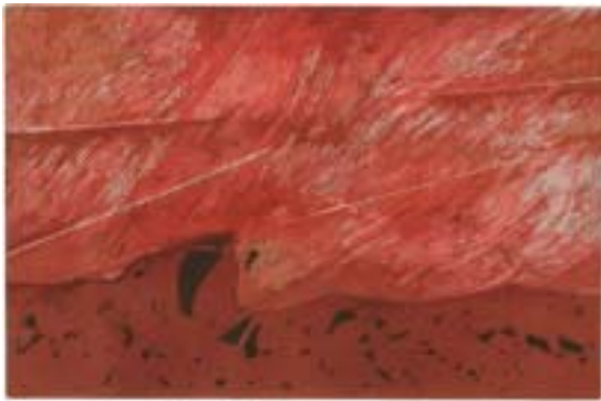
Monólogo (metal), 56 x 76 cm