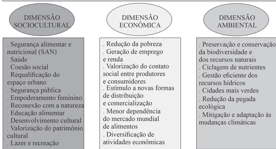
Figura 2 – Funções da Agricultura Urbana e Periurbana (AUP) divididas por dimensão.