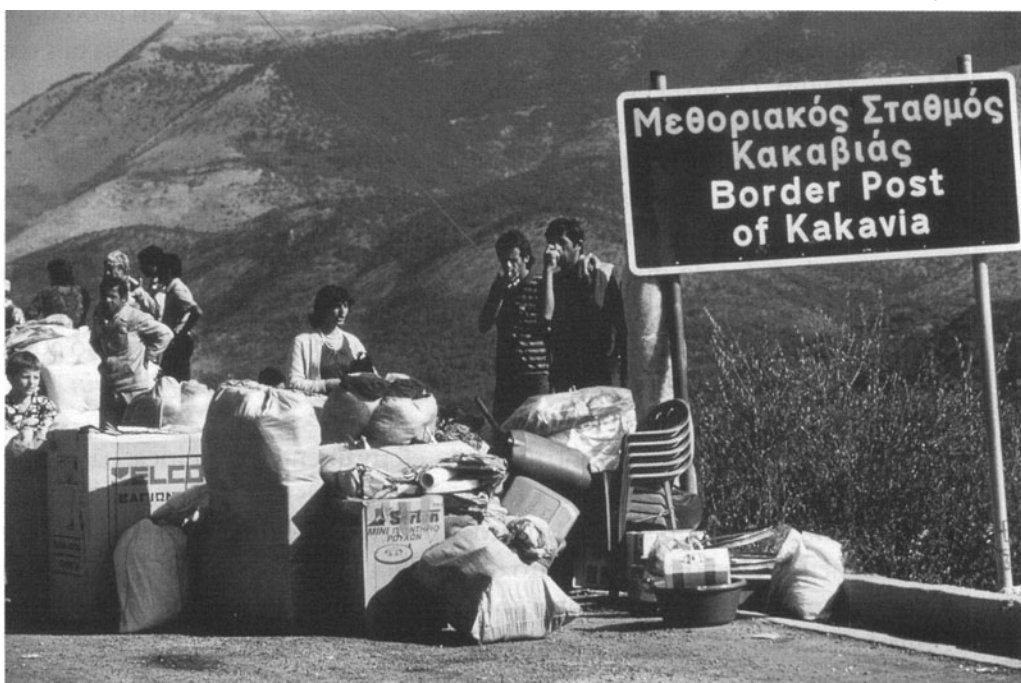
O drama de imigrantes albaneses na fronteira da Grécia