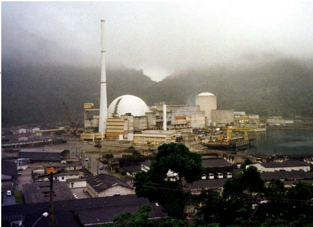
A Central Nuclear Almirante Álvaro Alberto, localizada na região de Angra dos Reis (RJ).