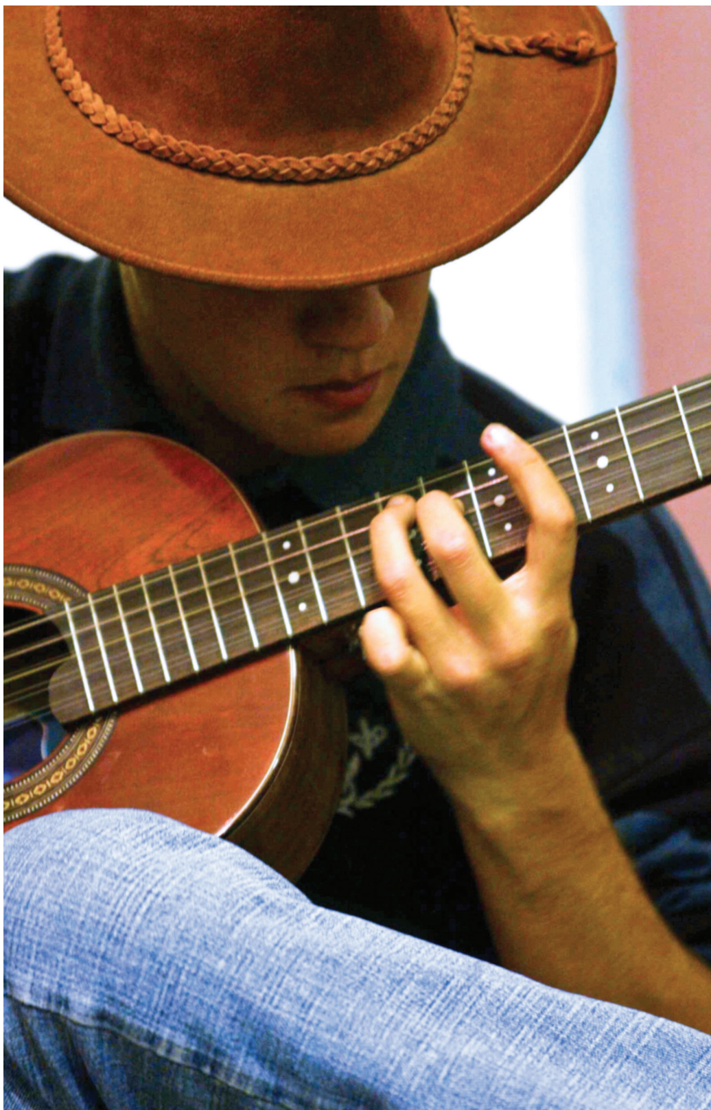
Músico da Orquestra Paulistana de Viola Caipira da Universidade Livre de Música Tom Jobim.