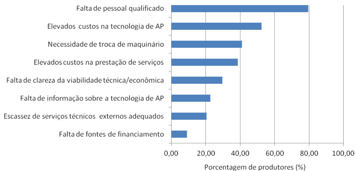
FIGURA 3. Problemas e obstáculos na adoção da agricultura de precisão considerados de alta importância pelos produtores (%) da região sudoeste de Goiás. Problems and barriers to adoption of precision agriculture considered highly important by farmers (%) from Southwest region of Goiás.

Com relação aos problemas e aos obstáculos sentidos pelos produtores na adoção da AP, verifica-se que a falta de pessoal qualificado e os altos custos da tecnologia de AP são os maiores obstáculos na opinião dos produtores (Figura 3). De acordo com COELHO (2008), os altos custos da tecnologia tendem a diminuir com o tempo com o maior número de produtores adotando a técnica, aliado à rápida evolução tecnológica. A falta de mão de obra qualificada para atuar na área de AP pode ser solucionada através de parcerias com instituições de ensino, pesquisa e extensão rural, com o objetivo de qualificar pessoal, haja vista a complexidade da atividade. A aquisição de novas máquinas e equipamentos, considerada por 40,91% dos produtores entrevistados como obstáculo de alta importância na adoção das tecnologias da AP, ocorre pelo custo de aquisição e de manutenção, além da necessidade da compatibilidade entre as diversas máquinas e equipamentos da propriedade.