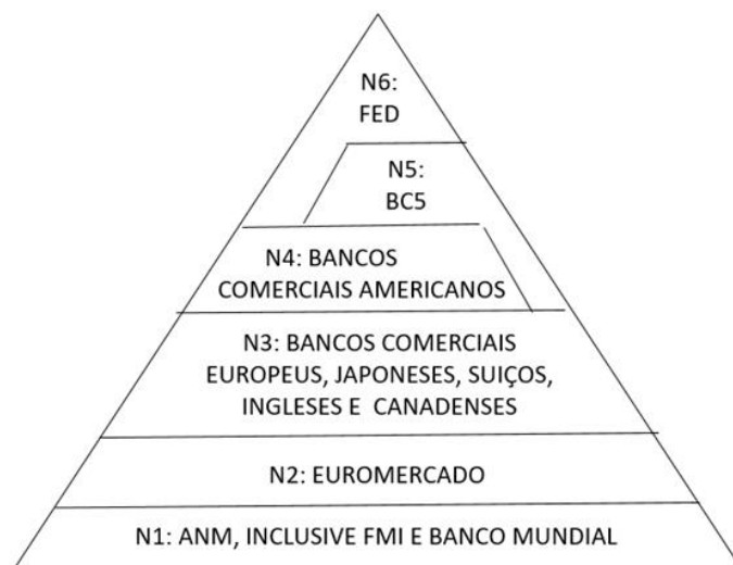
Figura 2 Hierarquia monetária do sistema dolarizado pós-2008

Um último comentário importante diz respeito às moedas internacionais, que não a norte-americana. Elas oferecem algumas das funções que o dólar exerce no exterior, mas foram deixadas de lado, por terem uma importância muito mais limitada geograficamente e em termos de mercado do que a detida pela moeda americana no SMI.