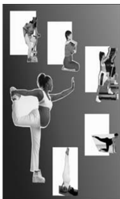
Figura 3 – Corpos puros e limpos