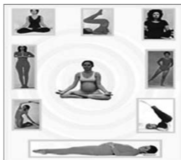
Figura 1 – Gestantes em Práticas Corporais