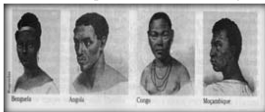
Figura 1 – Mozambique, Johann Moritz Rugendas, 1835