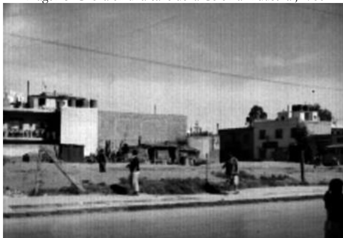
Imagen 3. Choza en una calle de la Colonia Industrial, 1955.