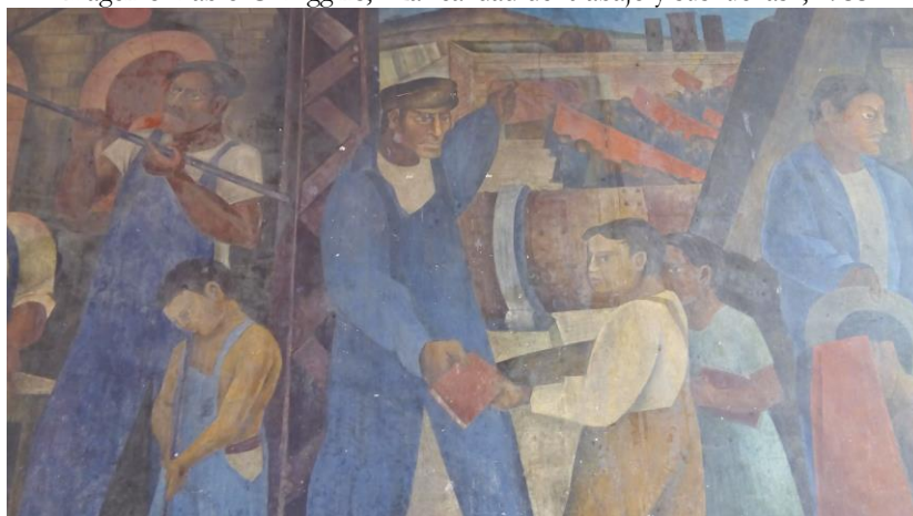
Imagen 8. Pablo O'Higgins, "La realidad del trabajo y sus luchas", 1933.