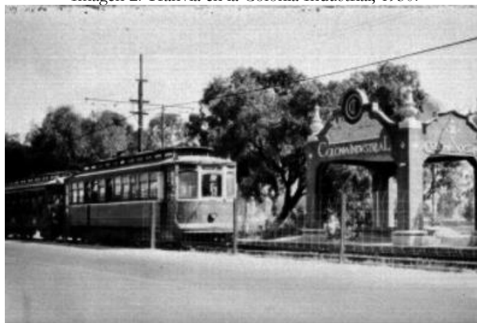
Imagen 2. Tranvía en la Colonia Industrial, 1930.