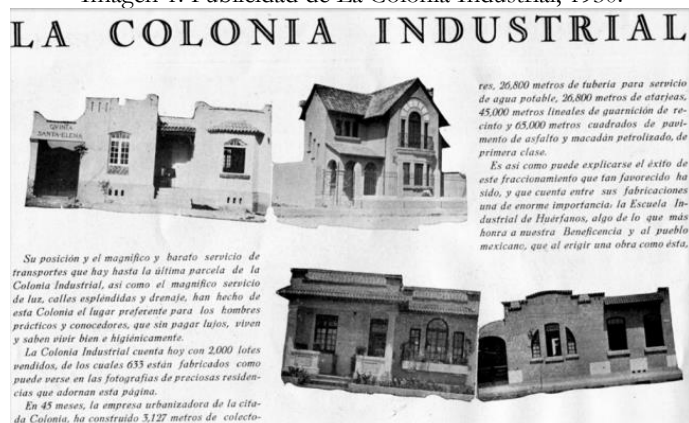
Imagen 1. Publicidad de La Colonia Industrial, 1930.