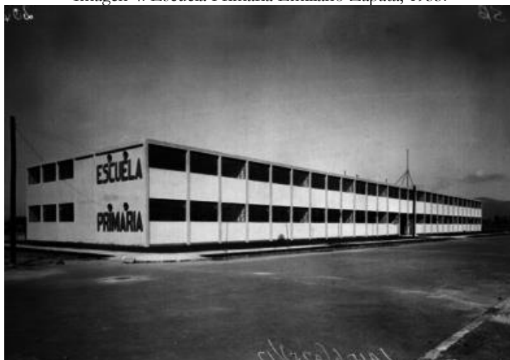
Imagen 4. Escuela Primaria Emiliano Zapata, 1933.

La caminata terminó frente a la escuela primaria Emiliano Zapata, cuyo edificio fue dividido posteriormente para albergar otra escuela primaria (la Escuela Primaria Jesús Romero Flores). Ahí pude observar lo que queda del edificio de 1932: la fachada, el muro ciego, los albañales, las aulas y la planta [Imágenes 4 y 5]. En el interior de la escuela Emiliano Zapata se encuentran, acusando un grave deterioro, los murales de Pablo O'Higgins sobre el trabajo, la lucha obrera y los problemas sociales.