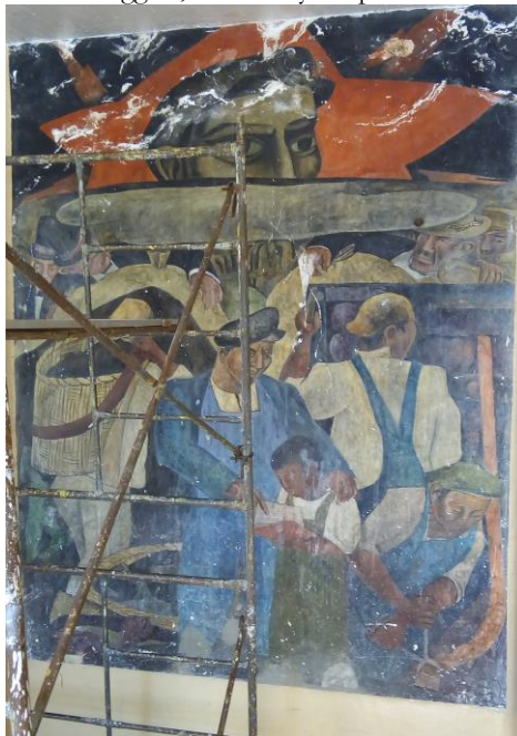
Imagen 7. Pablo O’Higgins, “La vida y los problemas sociales”, 1933.

Pero en “La realidad del trabajo y sus luchas” y en “La vida y los problemas sociales”, el gesto de los niños varía [Imágenes 7 y 8]. Mientras dos niños trabajan en la producción del vidrio, uno completamente desnudo y otro con el torso descubierto, otro, afuera de una mina, fija su atención en la parte del libro rojo que su mentor —el dirigente obrero— le indica. Otros más, un niño y una niña (la única mujer en las dos escenas), sugieren otras posibilidades. Aunque el dirigente obrero les extiende un libro rojo con la mano derecha y con la izquierda señala una manifestación proletaria, ambos niños desvían la mirada. No atienden al obrero, ni al libro ni a la manifestación. Dirigen su mirada hacia afuera del cuadro, en sentido opuesto a las indicaciones de su mentor, porque otra cosa los atrae.