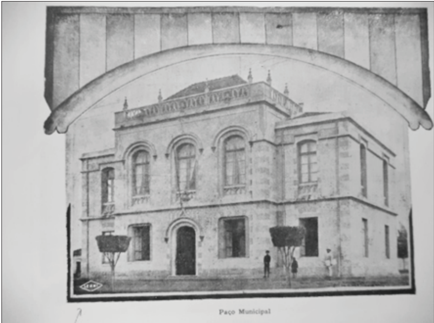
FIGURA 2 – Fotografia original da Câmara Municipal de Araraquara, executada por LEMMI (assinatura à esquerda) numa composição em close ligeiramente ascensional e diagonal. Destaque-se, ainda, a moldura que adorna a imagem, inserida posteriormente por Antonio M. França, organizador do álbum