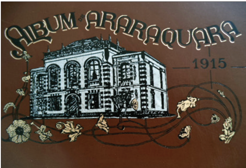
FIGURA 1 – Capa do Album de Araraquara , editado no ano de 1915, de onde sobressaem elementos propagandísticos que buscavam identificar a urbe ao progresso e ao gosto refinado: construção neoclássica entrelaçada em desenhos de inspiração art nouveau

Além disso, seguindo um padrão visual observado por Carvalho e Lima (2008, p. 94) nos álbuns da capital, também no exemplar do interior paulista notamos uma tendência geral nas fotografias observadas “em que o motivo sofre pouquíssimas distorções ou fragmentações. Procura-se evidenciar de maneira clara e sem ambiguidades o tema tratado”: afinal, trata-se de um suporte que apresenta a ilusão de documentar a realidade tal qual ela se apresenta. Simulacros – no caso dos álbuns, simulacro de uma realidade fundada no ideal do equilíbrio, da justa medida – para que se tenha a ilusão de que eles não ocultam nada, mas dizem tudo.