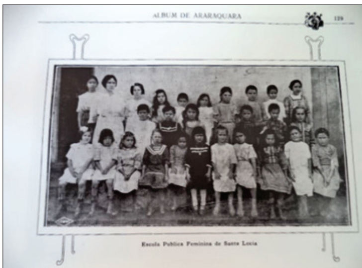
FIGURA 10 – Escola Feminina de Santa Lucia