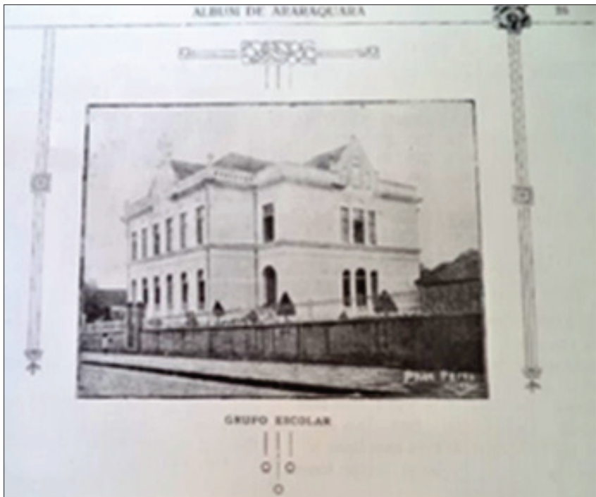
FIGURA 6 – Grupo Escolar de Araraquara

LEMMI e Photo Pérez são também os responsáveis pelo clichê do grupo escolar de Araraquara. O prédio foi construído em 1903, pelo governo do Estado, exclusivamente para funcionar como escola, conforme podemos observar na arquitetura neoclássica evidenciada, tendência muito difundida e ressignificada no Brasil por Ramos de Azevedo desde as últimas décadas do século XIX (WOLFF, 2010). No registro feito pelo grupo, temos uma tomada claramente diagonal e ascensional (FIGURA 6, 13,3 x 10 cm) num padrão de registro semelhante ao da Câmara Municipal.