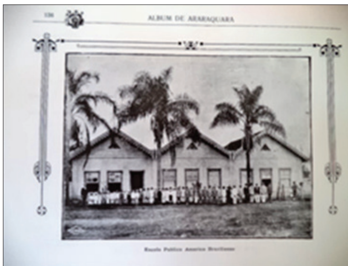
FIGURA 8 – Américo Braziliense