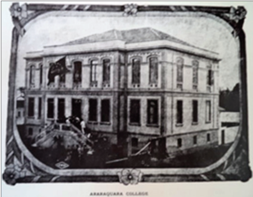
FIGURA 4 – Araraquara College, ginásio construído pela prefeitura da cidade e que seguia as diretrizes pedagógicas do Mackenzie College de São Paulo