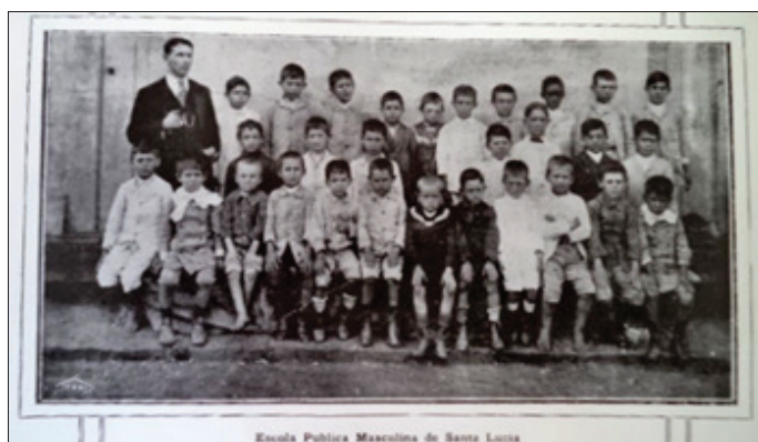
FIGURA 9 – Escola Masculina de Santa Lucia