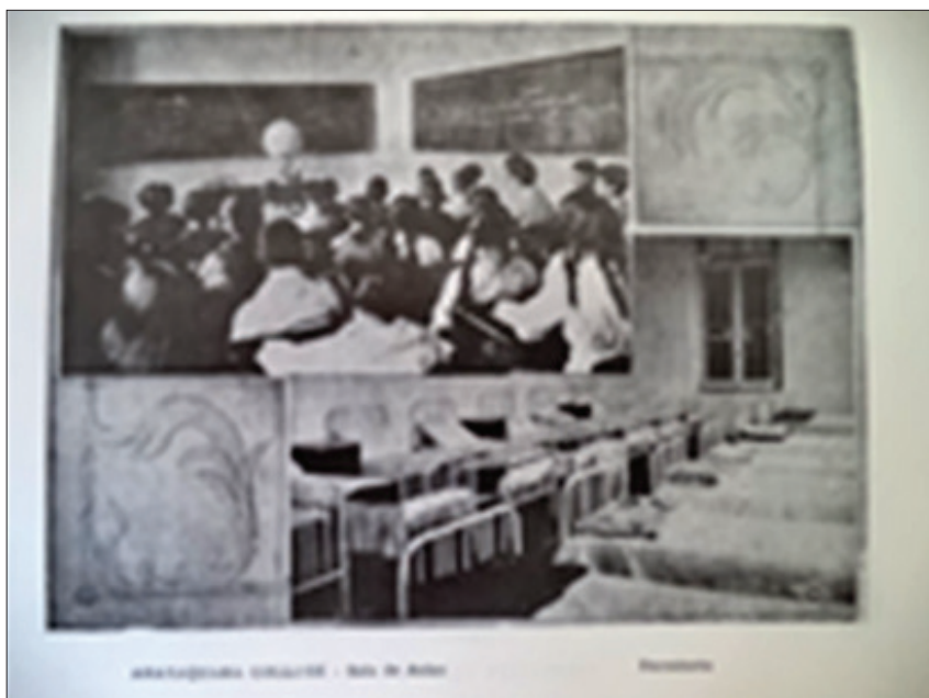
FIGURA 5 – Aspectos internos do Araraquara College

É o mesmo LEMMI quem retrata um dormitório do ginásio (FIGURA 5, canto inferior direito, 10 x 15 cm) com suas camas racionalmente dispostas e simetricamente arrumadas, testemunhando a ordem e o asseio necessários às “regras de hygiene escolar”, conforme anunciado. Um corpo classicamente acabado segundo ideais próprios àquele contexto aninha-se na foto, emparelhada a outra, que segue reproduzida. Sobreposta à imagem do dormitório, observamos uma fotografia que visa documentar um momento de sala de aula (FIGURA 5, canto superior esquerdo, 9 x 15 cm). Esta não tem autoria, e possivelmente foi recortada pelo editor para a montagem final realizada.