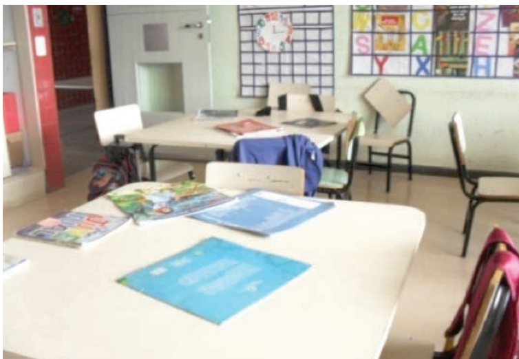
FIGURA 1. Foto de Márcio

Pesquisador: – Olha, Márcio, das fotos que você tirou das coisas que você faz na UMEI, qual delas você gosta mais?