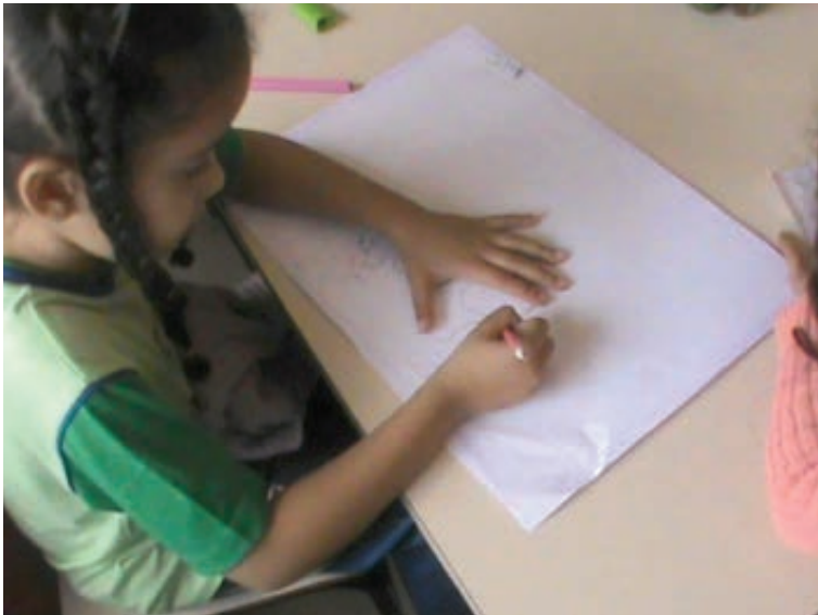
FIGURA 3. Fotografia produzida por Marcus

Pesquisador: – E quais são as coisas de que você não gosta?