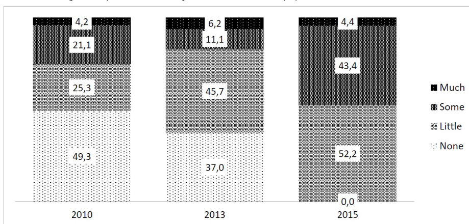
Gráfico 3 - Confiança nos partidos entre jovens estudantes (%)