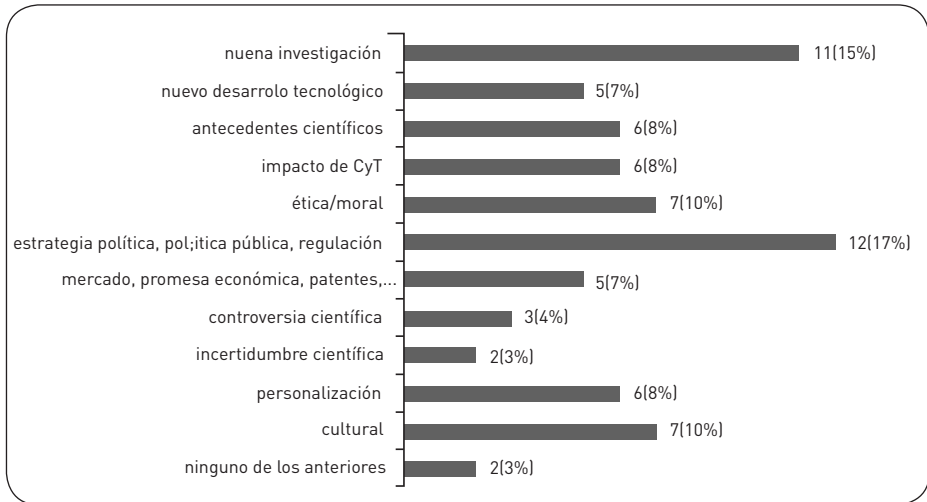
Figura 2: frames (o encuadres) utilizados en las notas

En lo que respecta a los frames (o encuadres), vamos a detenernos en algunos de los datos cuya clasificación aparece en la figura 2. En el protocolo que usamos, una nota podía ser clasificada hasta con tres tipos de frames diferentes (por eso el número total de frames es bastante superior al número total de notas). De las 38 notas, 12 (casi el 38%) presentan el encuadre “estrategia política, política pública, regulación”, con lo cual se puede inferir que explicitan una estrecha relación entre ciencia y decisiones del ámbito gubernamental o normativo, ya sea a nivel nacional o internacional. Las ya bastante demostradas relaciones estrechas entre ciencia y poder tienen su expresión en este caso.