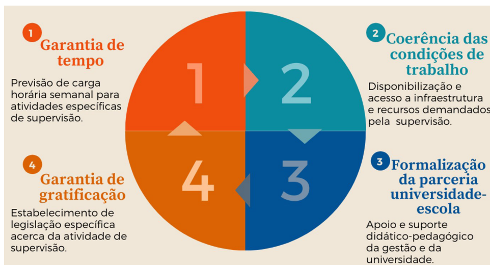
Figura 2. Síntese das categorias que englobam a formalização das condições de trabalho para o exercício da atividade de supervisão.

Na primeira dimensão, conforme Figura 2, formulamos quatro categorias que englobam a formalização das condições objetivas para a atividade de supervisão .