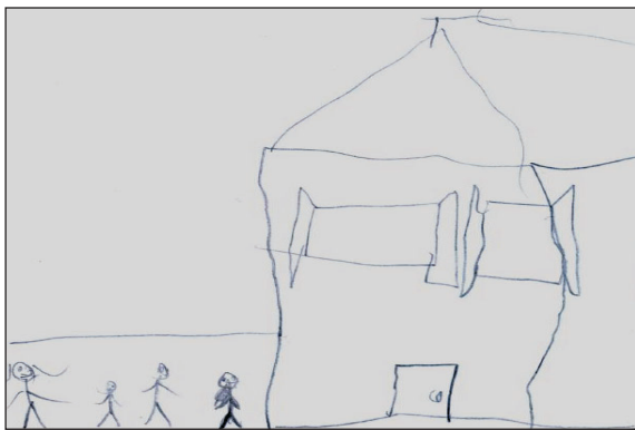
Figura 2. Criança 2, 8 anos. Desenhou a sua família, composta pela mãe, ela, o irmão e a irmã.