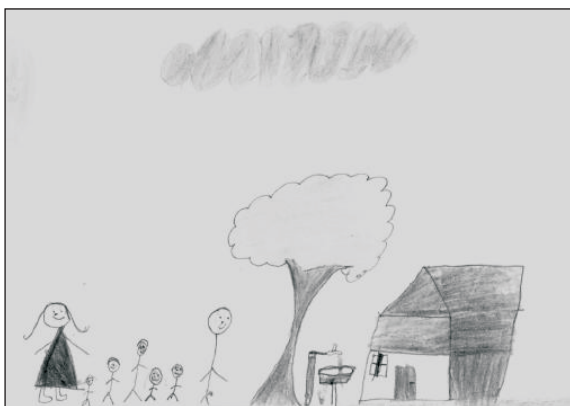
Figura 3. Criança 3, 9 anos. Desenhou a sua família, composta pela mãe, o irmão, outro irmão, ela, a irmã, o irmão e o padrasto.