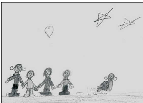
Figura 4. Criança 1, 10 anos. Desenhou a sua família composta pela mãe, o pai, oito irmãos (representados em dois) e a irmã brincando.

A presença “apagada” ou “turva” da figura paterna também foi percebida no estudo desenvolvido por Amazonas et al. (2003), no qual as autoras identificaram que em 70% das famílias investigadas o pai encontrava-se fragilizado devido ao desemprego, ao envolvimento com a polícia e/ou prisão, ao uso de drogas ou ao