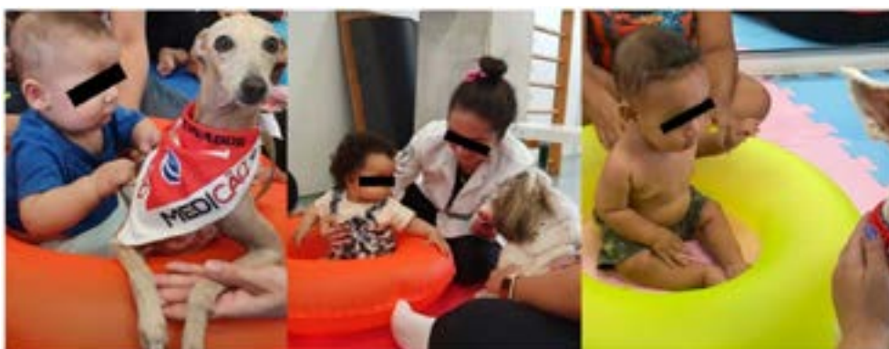
Figura 4. Atividade 3 do Grupo Cão

laterais (Figura 4). No início, a ajuda da mãe foi solicitada. No transcorrer da atividade, no entanto, o auxílio da mãe foi se tornando menos necessário devido à confiança demonstrada pelos lactentes.