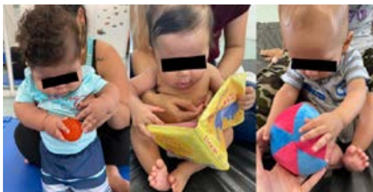
Figura 2. Atividade 1 do Grupo Brinquedo