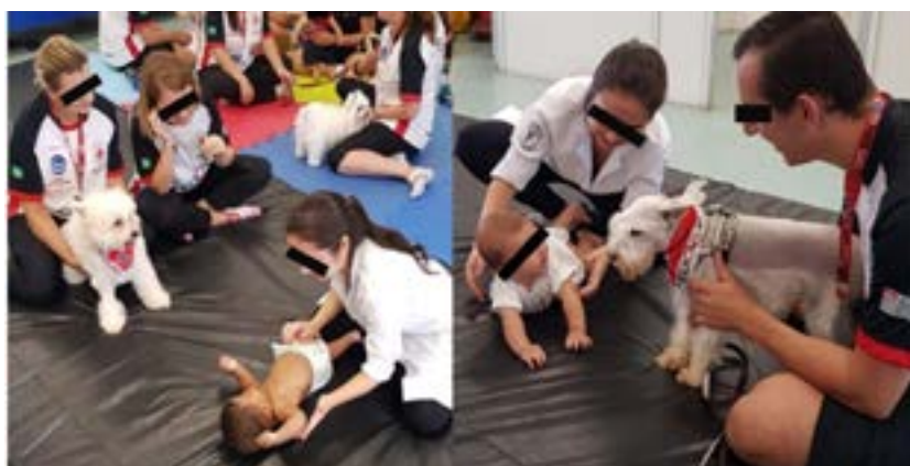
Figura 3. Atividade 2 do Grupo Cão

Na segunda sessão, o objetivo foi estimular os movimentos de se arrastar e rolar, sendo o cão o motivador do movimento (Figura 3). O animal ficava em frente ao lactente e a terapeuta oferecia ajuda com estímulo motor.