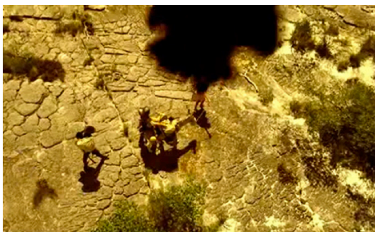
Fig. 7. Travessia dos retirantes em Gabriela

Nas cenas diurnas, quando os retirantes estão em trânsito, o que vemos na tela é uma sequência de planos gerais e planos conjuntos com personagens diminutos aos olhos do espectador. É a ambiência do sertão que se impõe sobre eles, como um verdadeiro obstáculo a ser vencido. Daí a nitidez do fundo natural, a presença física da terra. São planos que nos mostram uma paisagem árida, coberta por pedras, em cuja imagem predominam tons terrosos que simbolizam a secura do lugar. Nessas passagens a trilha é como a de um clamor.