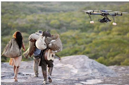
Fig. 10. Câmera montada em um drone do tipo octocopter.

a dimensão dramática que os realizadores pretendiam configurar: quão os personagens resultaram pequenos e frágeis diante da força e da vastidão do sertão a ser atravessado.