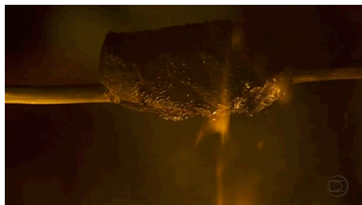
Fig. 6. Plano detalhe da carne.

Nas cenas diurnas, quando os retirantes estão em trânsito, o que vemos na tela é uma sequência de planos gerais e planos conjuntos com personagens diminutos aos olhos do espectador. É a ambiência do sertão que se impõe sobre eles, como um verdadeiro obstáculo a ser vencido. Daí a nitidez do fundo natural, a presença física da terra. São planos que nos mostram uma paisagem árida, coberta por pedras, em cuja imagem predominam tons terrosos que simbolizam a secura do lugar. Nessas passagens a trilha é como a de um clamor.