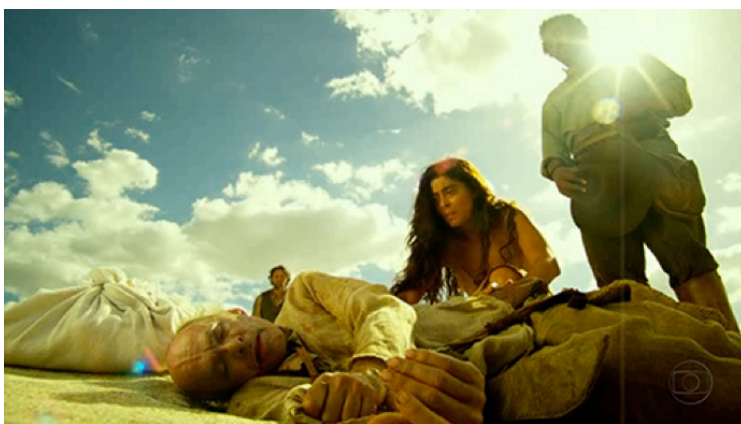
Fig. 1. Cena em que o tio de Gabriela é encontrado morto. Notamos todos os personagens definidos nitidamente em diferentes planos, assemelhando-se a uma pintura. A relação de latitude possibilitada pelas novas câmeras HD e seus acessórios permitem composições como esta na televisão.

A tecnologia HD também demanda câmeras específicas, como o uso de Prime Lenses , que possuem um campo focal fixo, uma maior profundidade de modulação e uma menor profundidade de campo. Todos esses aspectos técnicos refletem em uma reconfiguração da estética das produções televisivas, apresentando-nos produtos trabalhados visualmente de forma diferenciada, com mais detalhes em cena (fig. 01).