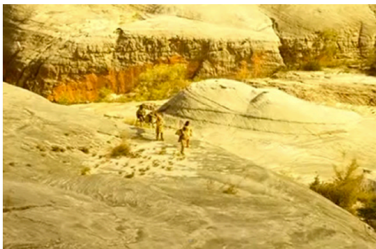
Fig. 8. A força do cenário no drama da travessia