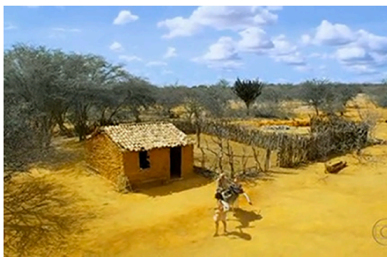
Fig.9. A força do cenário no drama da travessia

Nas figuras 7 e 8 a luz natural foi um dos componentes estilísticos explorados e a direção de fotografia não teve receio de jogar com as sombras, de transitar entre o claro e o escuro, de colocar em cena os elementos com aparência semelhante à vida real para provocar-nos alguma identificação com o drama encenado.