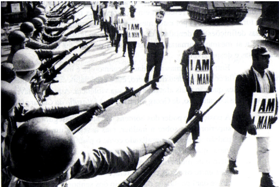
Figura 4. Expandindo a definição de masculinidade contemporânea: a era contemporânea testemunhou um desafio constante à masculinidade baseada na exclusão do outro – mulher, homem gay, homem negro, imigrantes. Foto: Trabalhadores em manifestação pelos Direitos Civis proclamam sua masculinidade, Memphis, EUA, 29 de março de 1968 (Kimmel, 1996).

Na virada do século, novos imigrantes europeus também foram somados à lista de outros subalternos. Os irlandeses afirmaram a sua reivindicação de masculinidade tornando-se “brancos” – estes que há muito eram vistos como não sendo de uma raça pura na Bretanha – os irlandeses assumiram um racismo cáustico enquanto comandavam uma reivindicação da classe trabalhadora contra o “salário escravo”. Os italianos também eram vistos como passionais demais e voláteis para possuírem realmente o autocontrole masculino. Os judeus eram demasiadamente almofadinhas, intelectualizados e miúdos para serem homens. Hoje em dia, os asiáticos é que são também vistos como pequenos demais, demasiadamente gentis, moles, sem pêlos e afeminados, ao mesmo tempo que são monstros selvagens, torturadores bárbaros e cruéis, despreocupados com a vida humana, como vimos na propaganda racista durante as guerras dos Estados Unidos contra o Japão, Coréia e Vietnã.