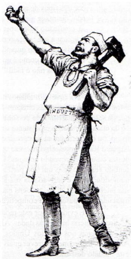
Figura 1. O Artesão Heróico é o ideal mítico do operário honesto, cuja virtude vem da sua dedicação à indústria. Este mito durou várias décadas, desaparecendo apenas recentemente. (Ilustração de Tomas Nast, publicada originalmente em 1882 – cf. Kimmel, 1996).

Em contraste, o Artesão Heróico incorporava a força física e a virtude republicana do fazendeiro yeoman , o artesão urbano independente, o dono de pequeno negócio. Também um pai devoto, o Artesão Heróico ensinava ao seu filho a sua arte, elevando-o ao status de mestre artesão através de uma iniciação ritual como aprendiz. Ele pendurava uma placa em sua loja onde se lia “Smith & Sons”. Nos Estados Unidos, pense em Paul Revere na sua oficina