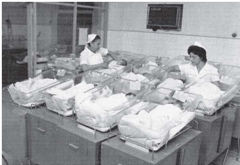
Figura 2: Berçário da Pro Matre, s.d.

A fundação da Maternidade Pro Matre acompanhou os primórdios de um movimento que marca a transição do parto doméstico para o hospitalar. Ana Paula Vosne Martins (2005) afirma que no Brasil essa transição ocorreu a partir dos anos 1930, atingindo diferentemente as mulheres conforme a classe social e a raça.