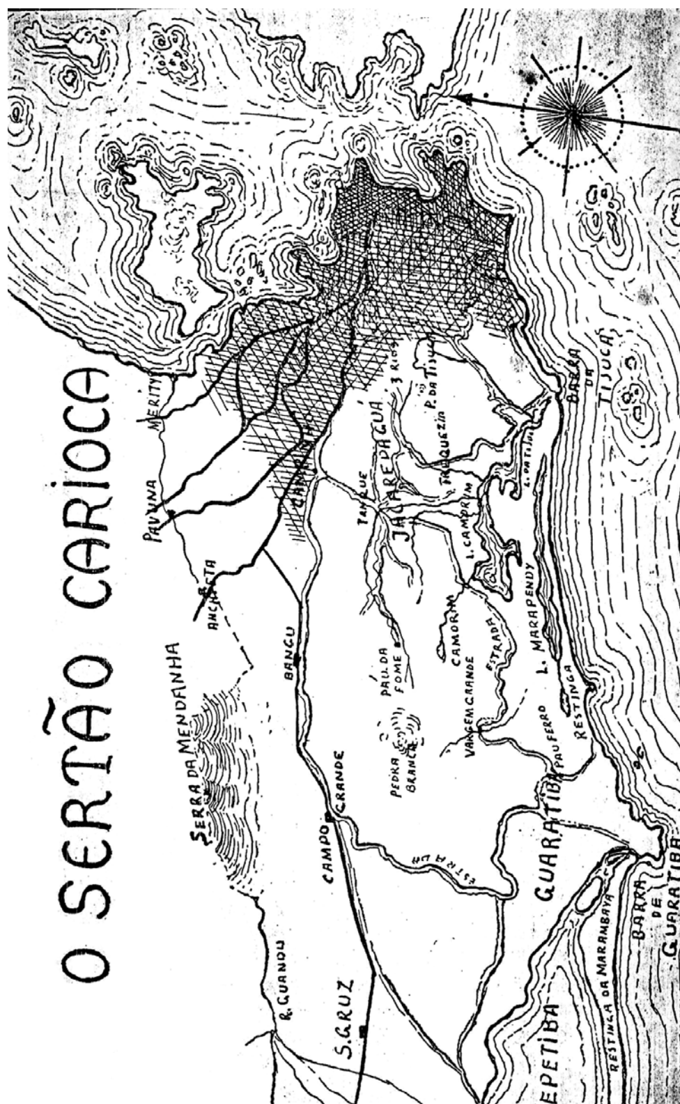
"Mapa do Sertão Carioca" p. 272, item XXII Mapa do Sertão Carioca, onde aparecem as localidades visitadas por Armando Magalhães Corrêa em seus périplos.