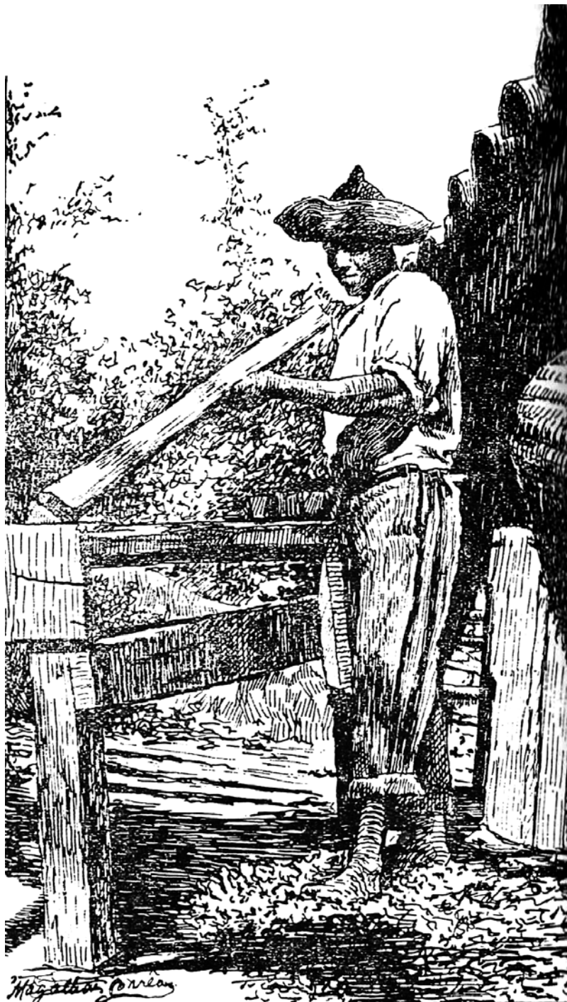
“O cabeiro” p. 125, Capítulo 2 (item IX)

A indústria de cabos (para machados, picaretas, marretas, foices etc.) também ajudava a derrubar as matas primárias e secundárias do ‘sertão carioca’. O cabeiro coletava as toras brutas – de árvores e arbustos jovens – de espécies com madeira resistente e as processava em pequenas oficinas. Usava burros para transportar os cabos prontos, vendidos às dúzias em feiras suburbanas e fábricas.