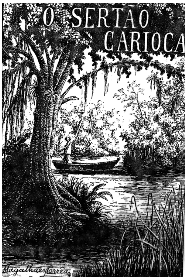
Capa de O sertão carioca Retrata a natureza e a gente do 'sertão', personagens principais do livro.

Segue-se uma seleção das dezenas de ilustrações estampadas na edição original de O sertão carioca . Cada ilustração está acompanhada da legenda original, escrita pelo autor, da página e do capítulo da edição original, e de um breve comentário redigido pelos autores do presente artigo.