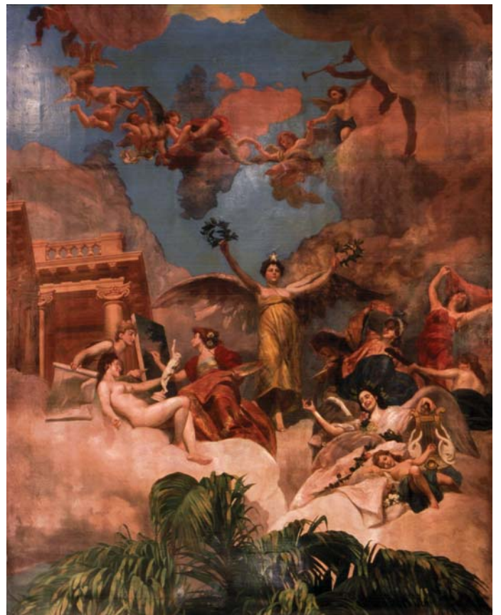
A glorificação das belas artes no Amazonas – vista parcial da pintura