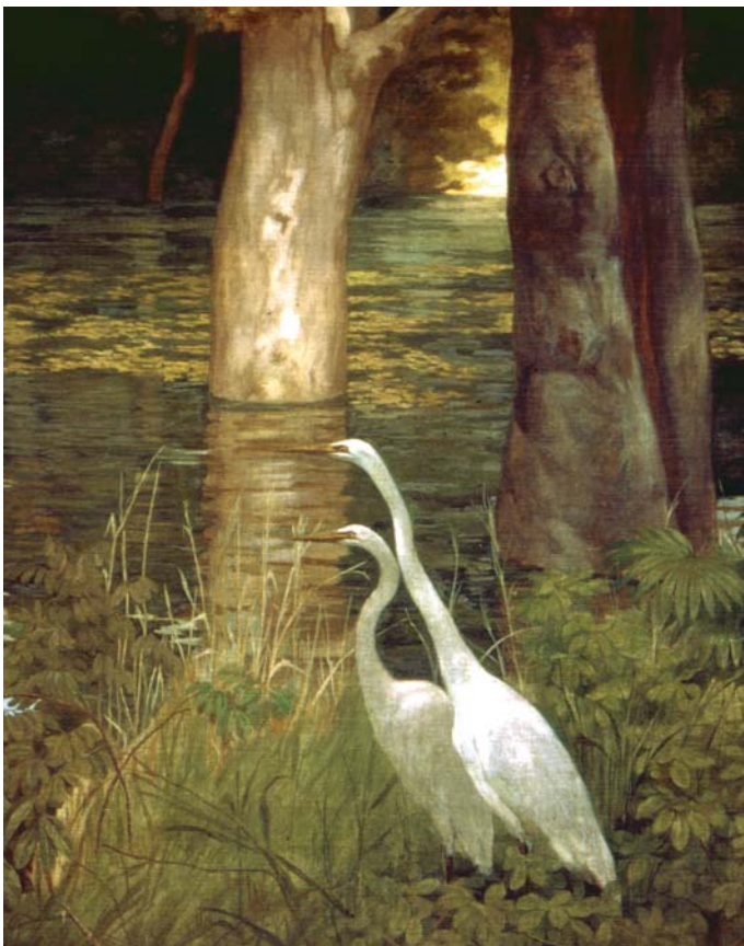
As garças – detalhe