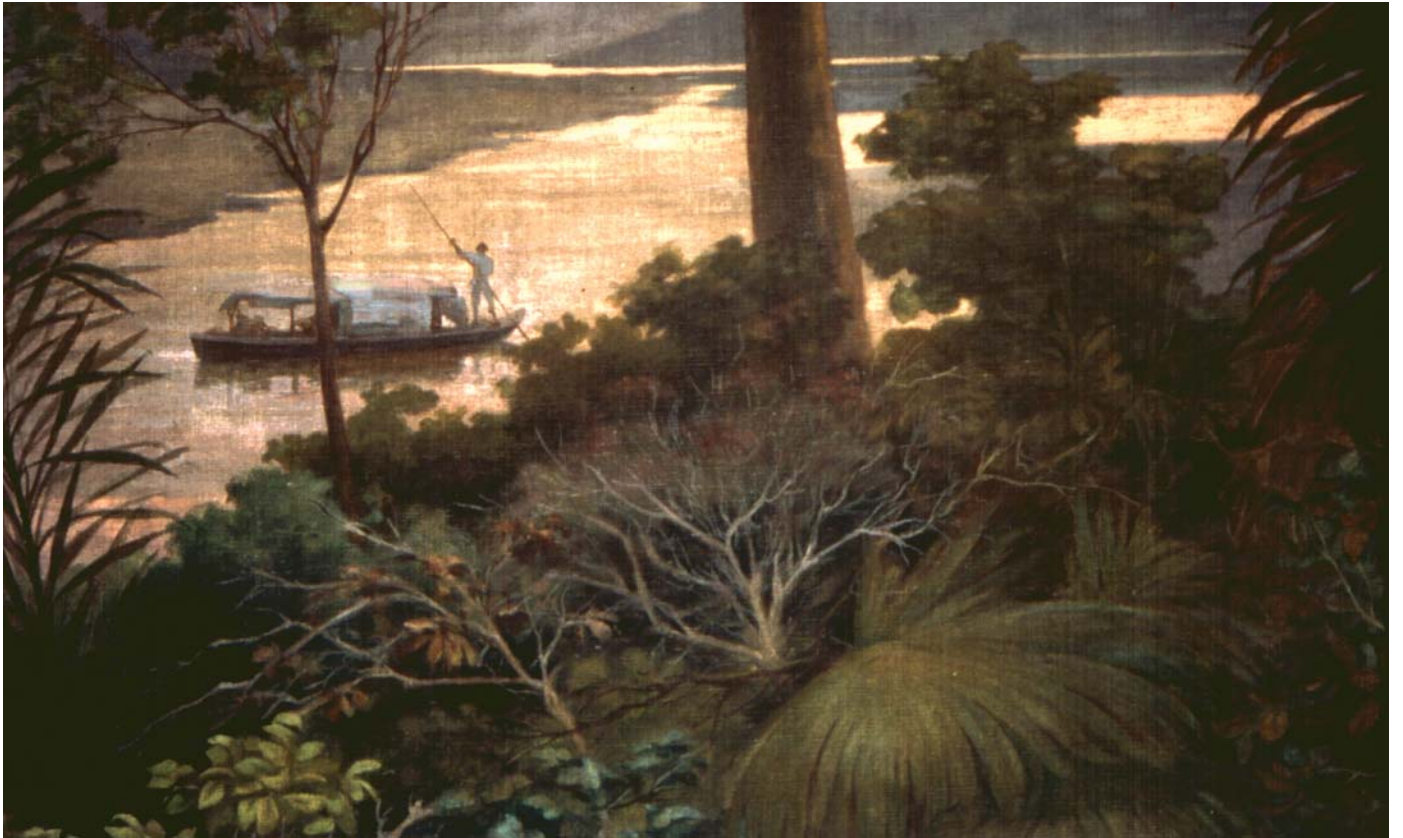
Igarapé e canoa – detalhe