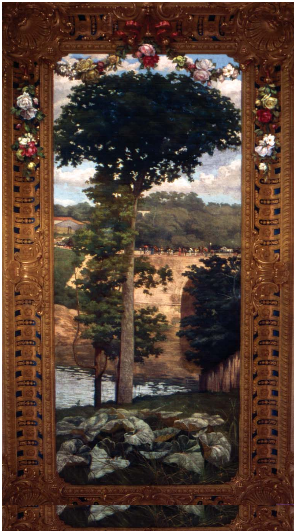
Passeio na ponte