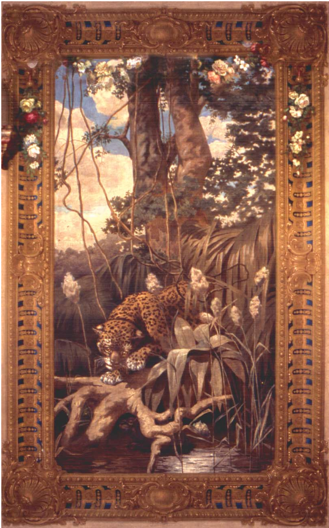
A onça caçando a capivara