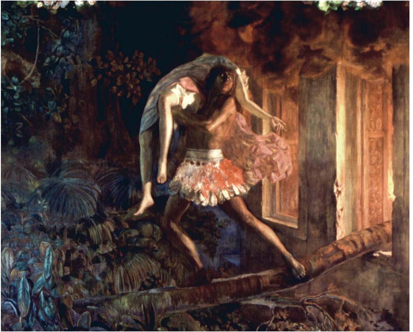
Ceci e Peri