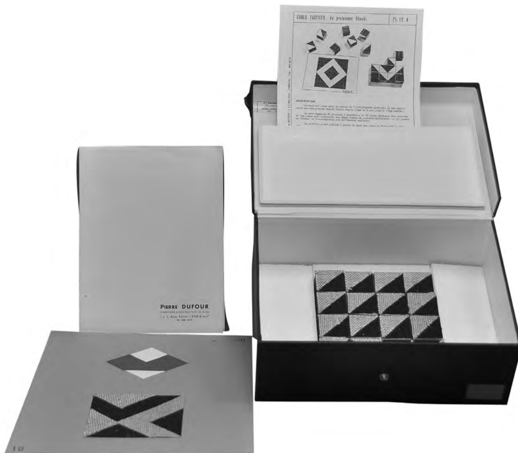
Figura 3: Ergógrafo