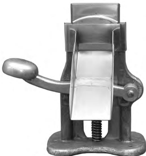
Figura 4: Máquina de fechar bisnagas