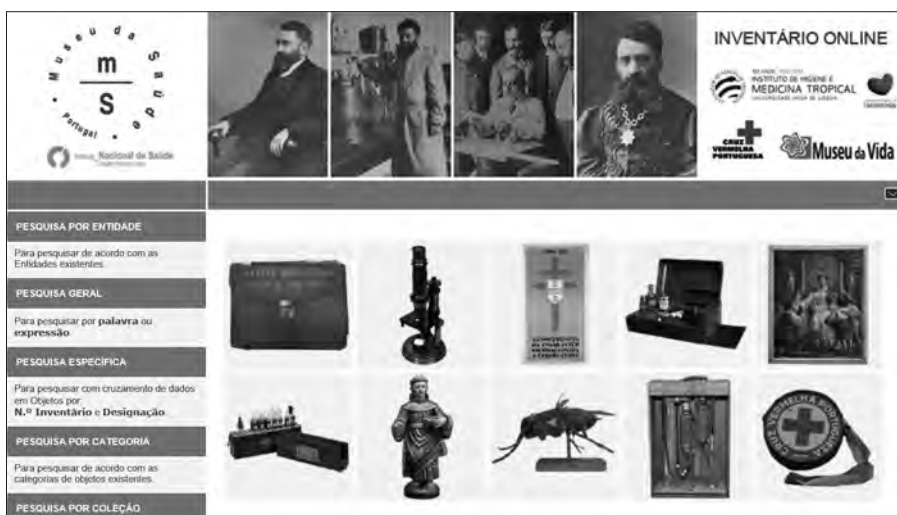
Figura 7: Plataforma in web do Museu da Saúde. Disponível em: http://museudasaude.inwebonline.net/default.aspx

Nessa plataforma há, ainda, a Peça do Trimestre, iniciativa partilhada por todos os parceiros do Museu da Saúde, segundo a qual, trimestralmente, uma das instituições publica o objeto que selecionou.