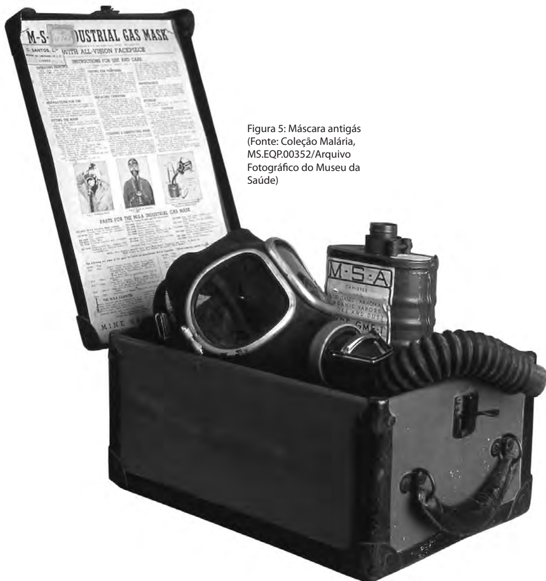
Figura 5: Máscara antigás