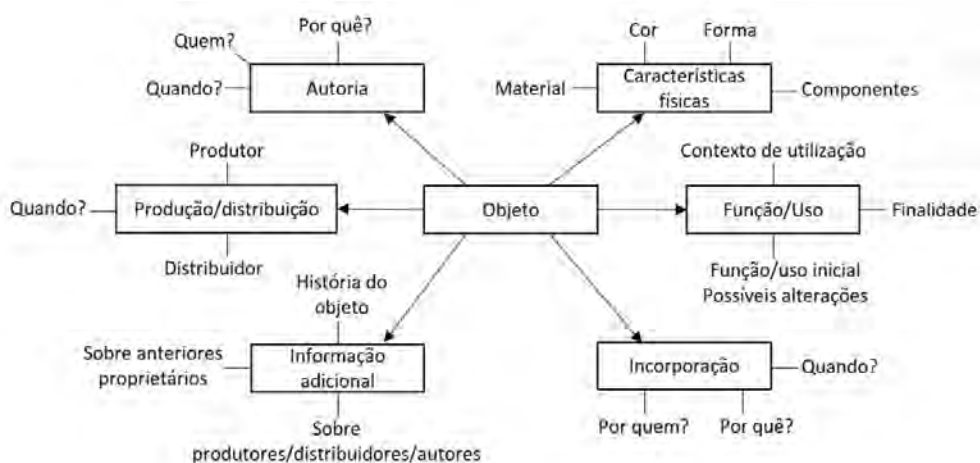
Figura 6: Matriz de dados do Museu da Saúde

(c) Relações com o contexto, que reporta para o ambiente físico e conceptual em que foi criado/utilizado (identidade contextual/significado).