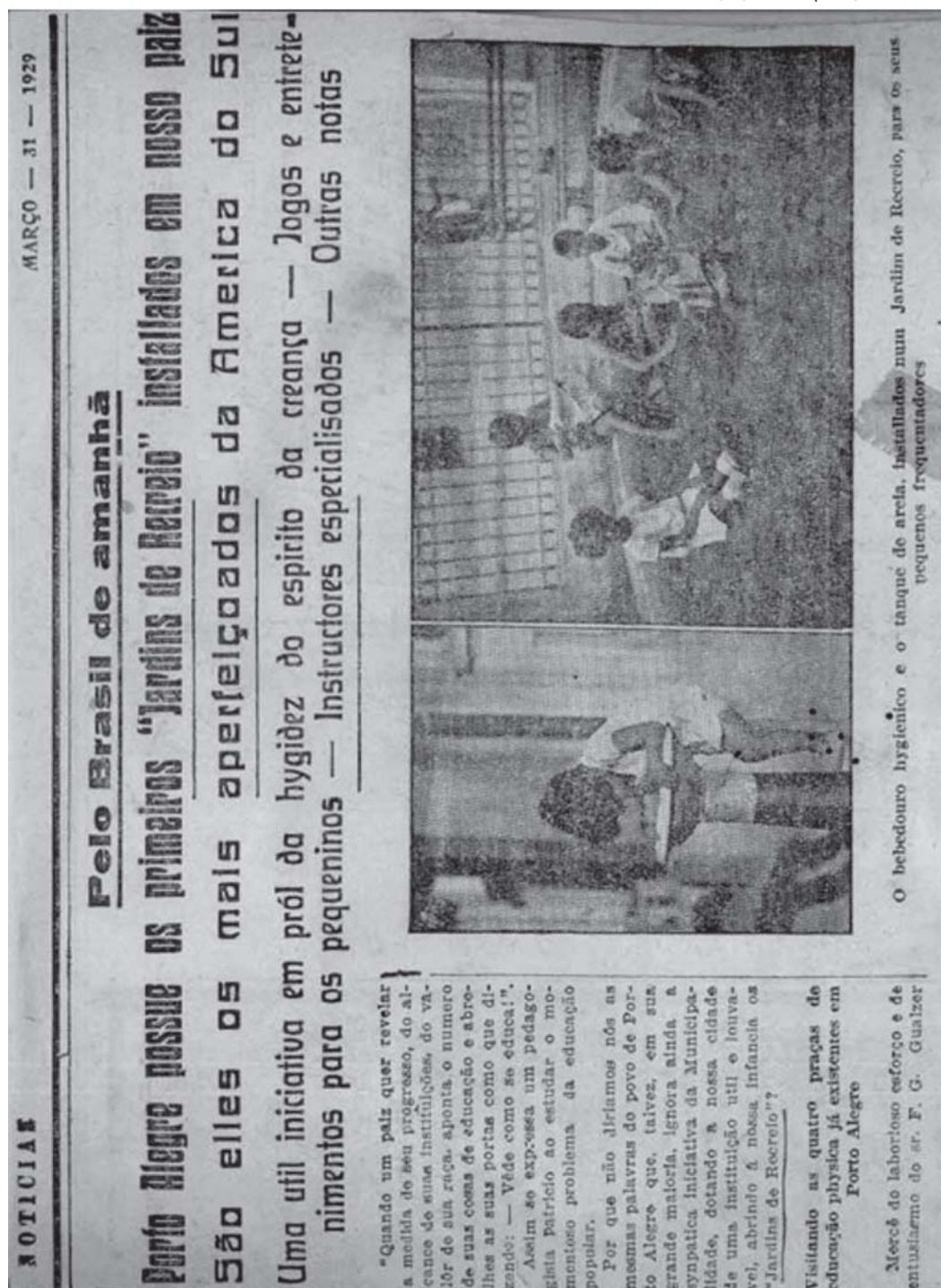
Figura 2: Reportagem publicada no Diário de Notícias em 31 de março de 1929, sobre os jardins de recreio — atividades de recreação realizadas em praças públicas. (Acervo Ceme)