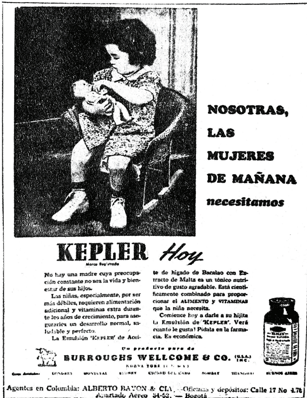
Figura 3: Nosotras, las mujeres de mañana necesitamos Kepler hoy (Nosotras..., 17 nov. 1944, p.7)

Así mismo, los avisos adoptaron la idea de brindar supuestos consejos a las madres sobre el cuidado infantil, de este modo empezaron a construir una serie de adjetivos y calificativos para denominar a las madres, entre los que estaban: “prudentes” (15 años..., 1 jul. 1919, p.3) “previsoras” (Metholatium, 22 ago. 1931, p.7), “cuidadosa” (¿Esta el niño..., 21 jun. 1933, p.9)