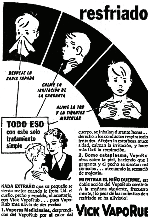
Figura 4: Alivie todos estos tormentos del resfriado (Alivie..., 9 mar. 1945, p.7)