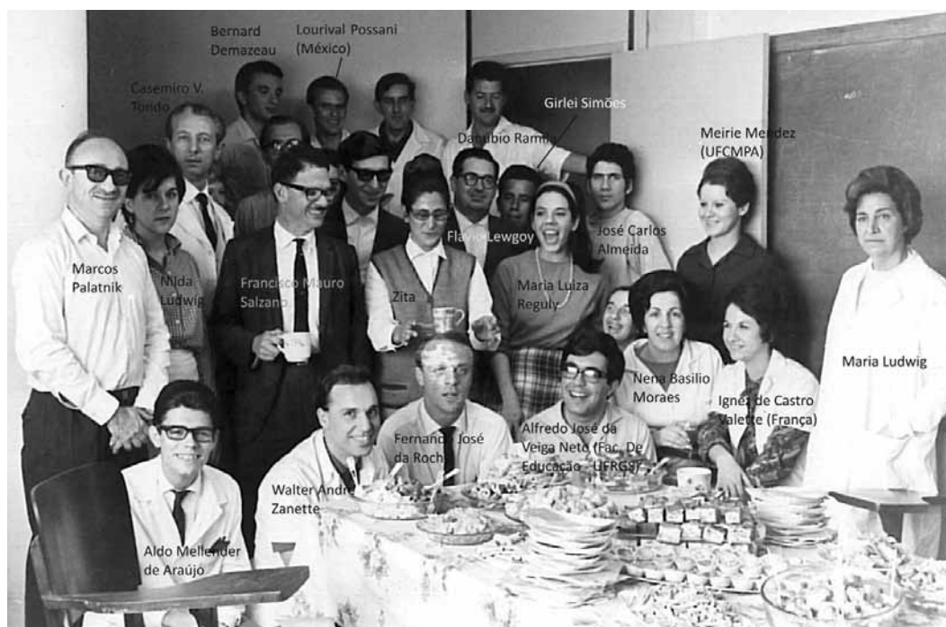
Figura 6: Comemoração de aniversário do Departamento de Genética, na sede da rua Professor Annes Dias (Museu da Genética, Universidade Federal do Rio Grande do Sul)