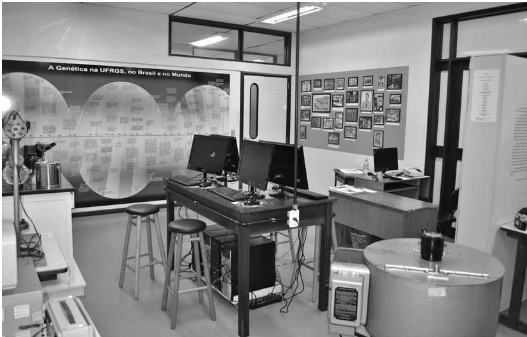
Figura 10: Vista parcial da exposição do Museu da Genética mostrando, à esquerda, reprodução de banca de laboratório; ao centro, computadores para uso dos visitantes; ao fundo, linha do tempo “A Genética na UFRGS, no Brasil e no Mundo” e exposição de fotografias; à direita, centrífuga adquirida na década de 1960 com recursos da Fundação Rockefeller (Museu da Genética, Universidade Federal do Rio Grande do Sul)