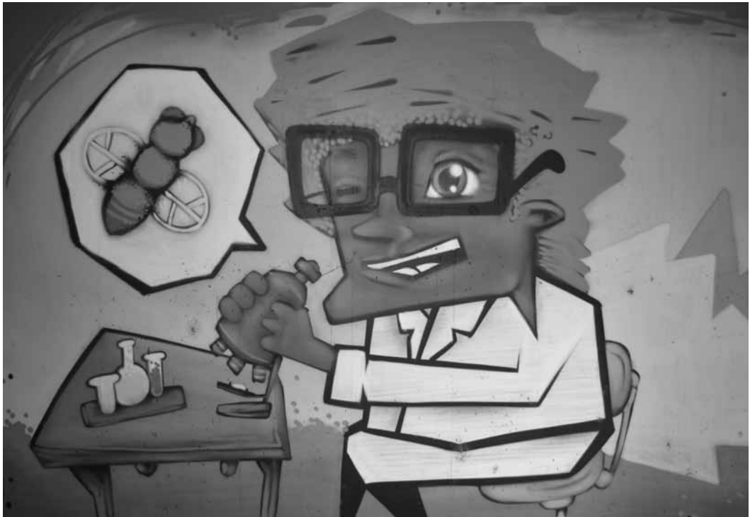
Figura 12: Imagem grafite na parede externa do Museu da Genética ( Campus da Universidade Federal do Rio Grande do Sul)

Em paredes externas do prédio onde está localizado o Museu (Figura 12), há um conjunto de imagens no estilo grafite, destinadas a chamar a atenção de um público de perfil jovem, que constitui a maior parte das pessoas que circulam nos campi universitários. Coloridas e de grandes dimensões, fazem referência a símbolos icônicos da genética, como a mosca-da-fruta (drosófila), o microscópio, outros instrumentais científicos e a dupla hélice de DNA. A vertente de espaço de divulgação científica é, portanto, bastante proeminente na proposta do Museu.