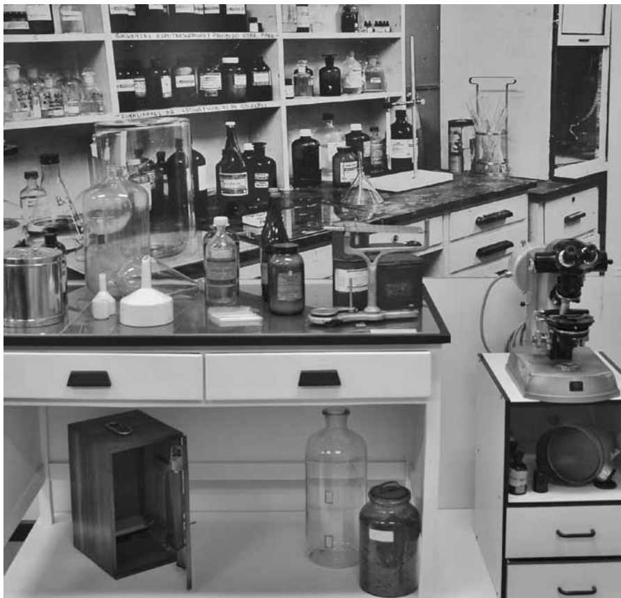
Figura 11: Imagem da exposição do Museu da Genética que reproduz antiga bancada de laboratório (Museu da Genética, Universidade Federal do Rio Grande do Sul)