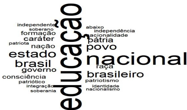
Figura 2 – Vocabulário presente nos debates da ICNE (1927) relativo ao conceito de independência e os seus correlatos semânticos.