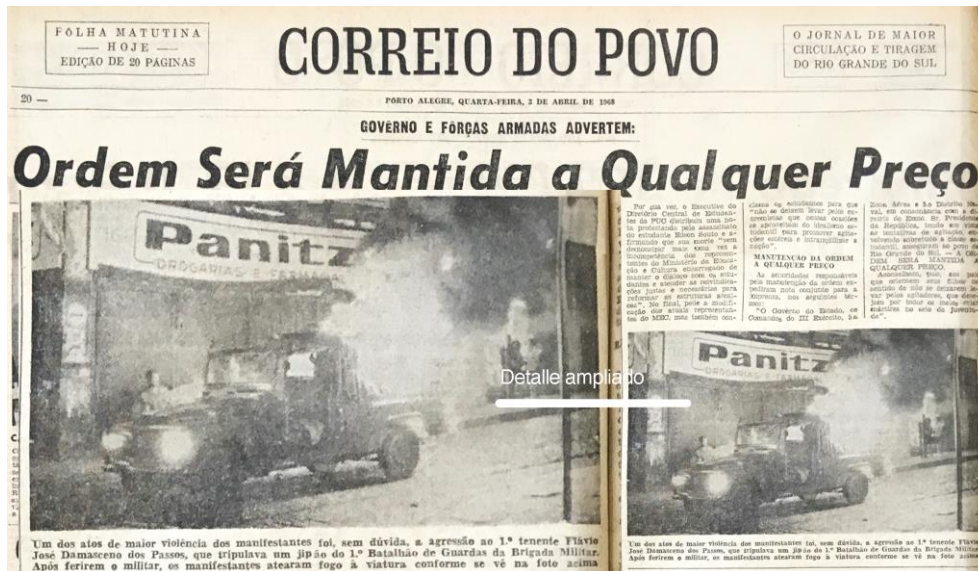
Figura 02 - Efeitos das manifestações estudantis em Porto Alegre.