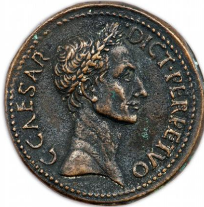
Fig. 2 – Moeda romana com a efigie de Gaio Júlio César

Terra, o monarca seguia o exemplo de Jesus Cristo. O rei é o escolhido de Deus para o representar em terra, e a iconografia de Cristo é adotada como símbolo real. A cerimônia de unção aproxima o monarca terreno a Cristo, tornando-o um ser santificado, o unguído.