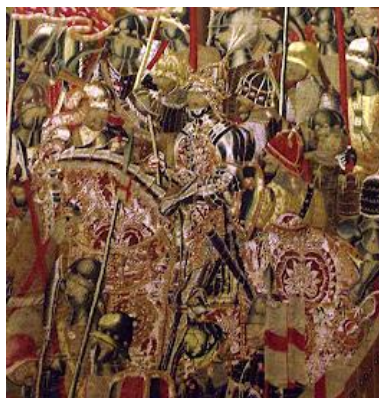
Fig. 6 – D. Afonso V, tapeçarias de Pastrana

Tapeçarias de Pastrana . Estas representam o melhor exemplo (chegado até nós) de um retrato de um rei português: D. Afonso V, a que se juntou o infante D. João.