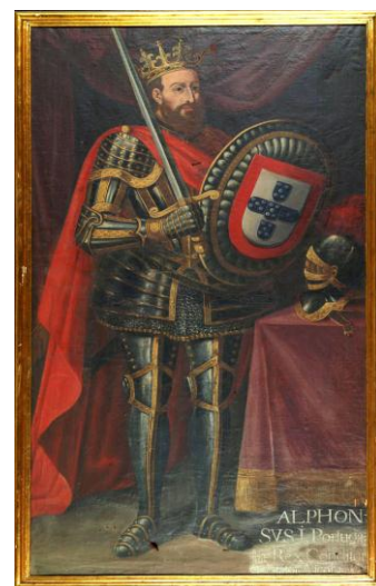
Fig. 4 – D. Afonso Henriques

Buscamos as representações clássicas, é verdade. Sentimos nos reis medievais portugueses a mesma identificação com as grandes personagens do Mundo Clássico. Mas há mais do que isso. Existem outras representações das várias dimensões do poder. Na lenda de Ourique bebem-se outras tradições. Cristianizadas, claro. Mas potentes, fazedoras de reis. Alexandre Magno, Júlio César e Artur, rei dos Bretões, juntam-se neste ocidente ibérico onde um novo rei é feito por «velhas» formas vindas dos confins da Germânia. E, noutra sentido, esta cerimônia, a de alçar (fazer) um rei é apenas de contexto militar – é propiciatória, mágica, simbólica – mas é feita, apenas, em contexto masculino. Ao elemento feminino está vedada esta parte da construção de uma nova potência. Mais