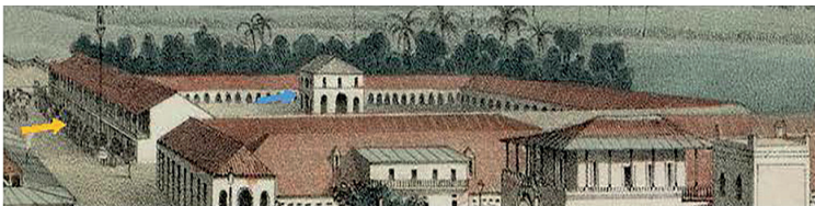
Figura 1 - Detalhe do barracão do engenho Flor de Cuba, com a seta amarela indicando a parte da frente do barracão, no piso inferior, e a seta azul, a cozinha