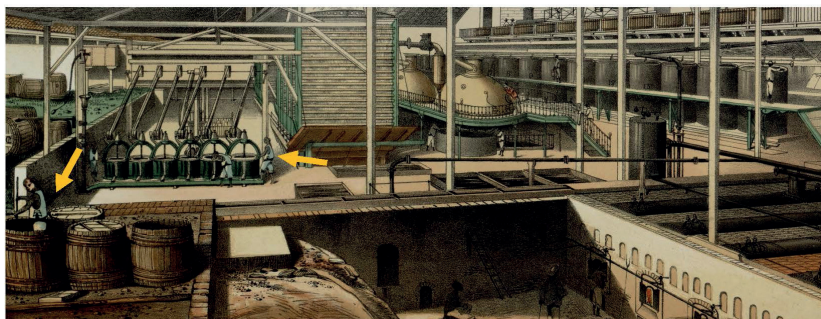
Figura 2 - Detalhe da casa das caldeiras do engenho Santa Rosa. As setas amarelas apontam chineses no local de trabalho

No caso cubano, nota-se, pelas litografias de Laplante, que em alguns ingenios os chineses podiam trabalhar ao lado dos escravos na casa das caldeiras (Figuras 2, 3 e 4). Essa era uma das etapas essenciais do processo produtivo de açúcar e, dos chineses sob contrato, segundo as avaliações de Juan Pérez de la Riva (1978, p. 74-75), entre 1/5 e 1/3 labutavam nessa etapa do processo produtivo. Contudo, a regra era concentrá-los no corte da cana.