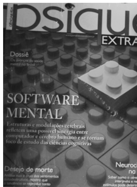
Figura 5. Revista Psiquê – Software Mental