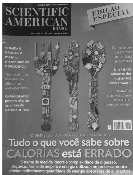
Figura 4. Revista Scientific American – calorias