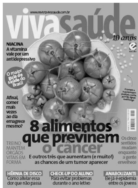
Figura 6. Revista Viva Saúde

Nesses casos, comprovamos a força retórica da simbiose imagem/palavra. Analisando apenas o texto das manchetes, apreenderemos a intenção de quem concebeu a capa. É na junção imagem/palavra que vem, à tona, a mensagem sugestiva de que tanto a alimentação como a psicanálise devem ser submetidas a critérios específicos, que situam um “biológico” (nutricional e neurológico) específico como base da concepção do que é saúde. Não é apenas o natural, mas o humano e seus saberes , que são sutilmente descartados nas sugestões ilustradas nas capas das revistas.