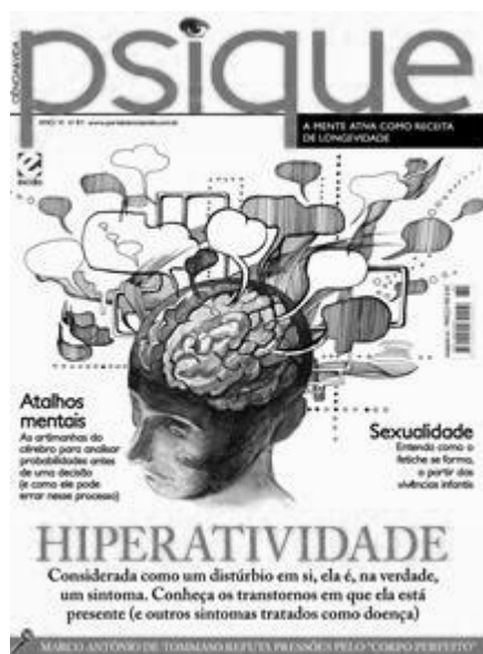
Figura 3. Revista Psiquê - Hiperatividade

Como ilustração da proposta de análise metodológica, descrevemos a capa de uma delas com o título (Figura 3): " Hiperatividade: Considerada como um distúrbio em si, ela é, na verdade, um sintoma. Conheça os transtornos em que ela está presente (e outros sintomas tratados como doença) " (p) .