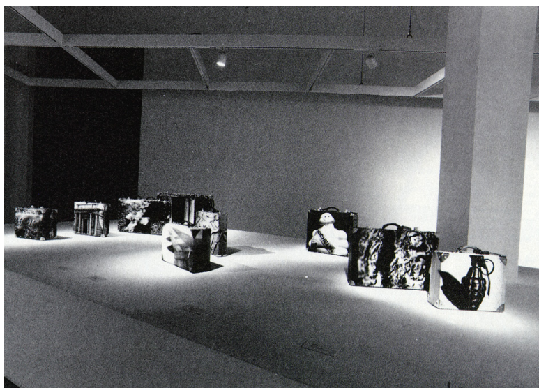
ALAN BELCHER, Instalação da exposição na Power Plant, Toronto. 20ª Bienal Internacional de São Paulo

Este quadro representa um dos motivos relevantes para a minha crença sobre os abusos praticados pelos médicos e empresas serem compensados essencialmente pela disseminação de informações e estratégias que equilibrem a assimetria do encontro médico-cliente/usuário/beneficiário. As informações devem ser promovidas por organizações não-governamentais, grupos de defesa dos consumidores, agências governamentais, universidades e clientelas organizadas. Neste caso, nos situamos dentro de soluções voltadas à qualidade das escolhas individuais e este é um ponto de convergência, apesar dos termos distintos da discussão, que observo com o instigante artigo de Merhy.