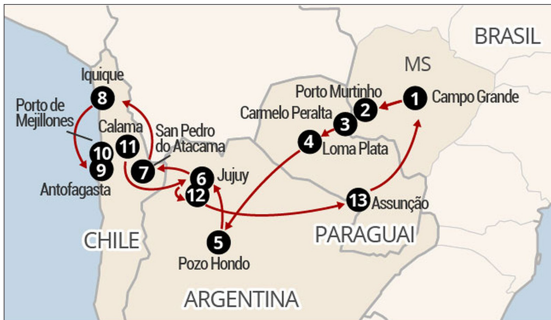
Figura 1 – Mapa da Rota de Integração Latino-Americana (Rila)