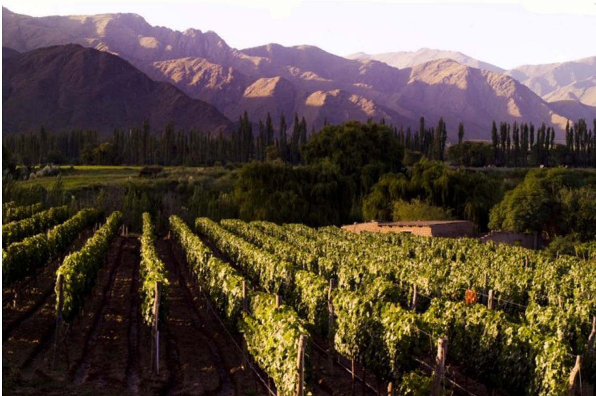
Figura 2 – Ruta del vino (Rota do Vinho), em Salta, na Argentina