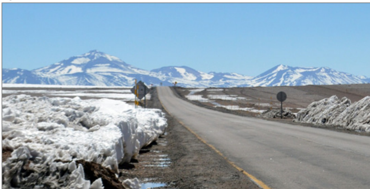
Figura 4 – Trecho Chileno de Cordilheira dos Andes

As particularidades do Deserto do Atacama, como o Chá de Coca (Figura 3), são típicas de países de altitude. O trecho de Cordilheira, que compreende Argentina e Chile, pelas belezas naturais da vegetação, fomenta o turismo de contemplação. Ocorre mencionar que mesmo antes da construção da ponte, será necessário adequar a infraestrutura nas estradas, com pontos de apoio, postos de combustível, oficinas automotivas, rede hoteleira, a devida sinalização turística e a melhoria nos serviços de comunicação. Os trâmites aduaneiros serão revisados para agilizar a logística do transporte de cargas, um filão que também impulsionará o turismo de negócios, estimando um aumento considerável de veículos à medida que as rodovias estiverem pavimentadas e prontas para o tráfego de todos os tipos de veículos.