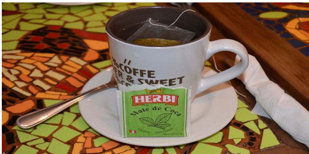
Figura 3 – Chá de folha de Coca, usado para amenizar os efeitos da altitude

A composição terrestre, com o término da obra da ponte binacional Brasil/Paraguai, fortalecerá a conjugação dos destinos turísticos entre esses países (leem-se os quatro países que pertencerão ao Corredor Rodoviário). Possibilidades de “rotas dentro do Corredor”, como a conjugação de Salta versus Deserto do Atacama e Antofagasta, em roteiro de 10 dias e 9 noites, de forma terrestre ida e volta desde Campo Grande, e para os que dispuserem de mais dias, conjugar a volta por Assunção, no Paraguai.