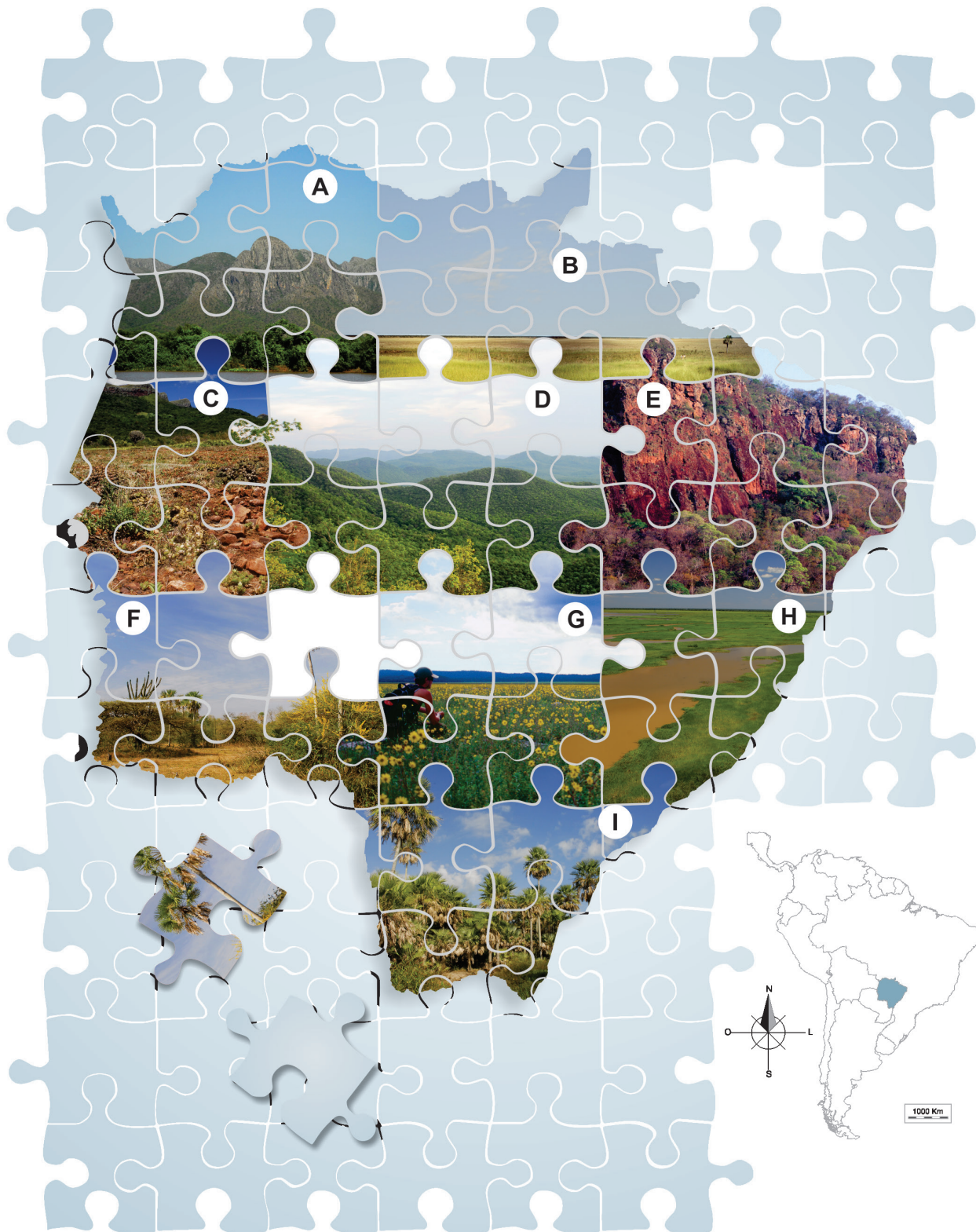
Fig. 1. Algumas paisagens e ambientes de Mato Grosso do Sul. A) serra do Amolar; B) Coval, nascente do Sucuriú; C) bancada laterítica em primeiro plano e morraria do Urucum ao fundo; D) planalto da Bodoquena; E) borda oeste do planalto de Maracaju, em Piraputanga, com floresta estacional decidual; F) fitofisionomia chaquenha do tipo chaco arborizado, município de Porto Murтинho; G) Lagoa das Pedras, município de Bonito, com predomínio de Dimerostemma annuum (Hassl.) H. Rob. (Compositae), registro de março de 2000; H) planície alagada (Pantanal) com arroz nativo, próxima à foz do rio São Lourenço; I) carandazal ( Copernicia alba Morong. (Arecaceae)), município de Porto Murтинho. Nem todas as imagens coincidem com a localização no mapa.