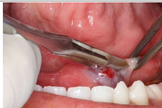
FIGURA 2 – Realização de procedimento cirúrgico cuja finalidade foi marsupialização da lesão e remoção de tecido (biópsia) para análise histopatológica