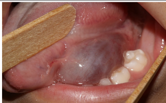
FIGURA 1 – Aparência clínica do cistadenoma; lesão de cor arroxeada em assoalho bucal

A análise microscópica dos espécimes corados com hematoxilina e eosina (HE) evidenciou lesão bem circunscrita – na qual as células luminais apresentavam-se colunares, e as células não luminais tinham formato cuboidal – com múltiplos compartimentos císticos de tamanho variável, revestidos por epitélio com dupla camada de padrão oncocítico. Um padrão de crescimento papilar também foi observado em algumas áreas da neoplasia. Não foram observadas atipias celulares ou figuras de mitose, o que indica o caráter benigno do tumor. A cápsula e o estroma da lesão eram constituídos por tecido conjuntivo fibroso denso com numerosos vasos sanguíneos ( Figura 3 ), conferindo, portanto, o diagnóstico de cistadenoma.