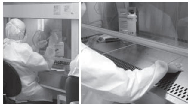
Figura 2 – Técnico realizando o procedimento de ANT (A) e procedimento de limpeza com álcool a 70% após o término das atividades (B)

No caso de fungos houve crescimento espalhado; cocos e outro bacilo apresentaram uma a duas colônias.